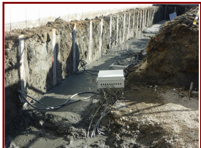
建築の不同沈下復元 (JOG工法)