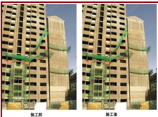
高層建築の不同沈下復旧工事