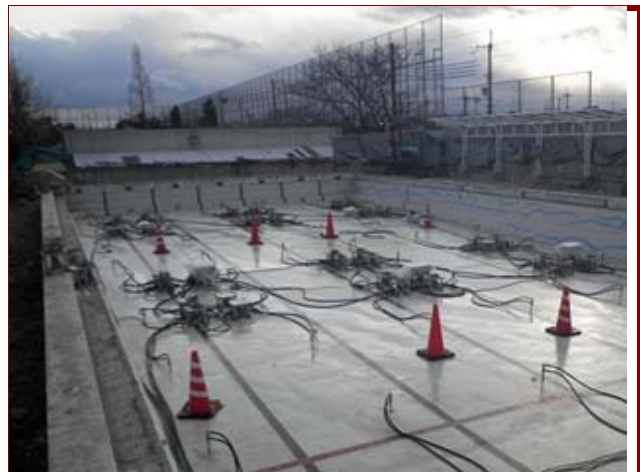
学校プール不同沈下復旧工事