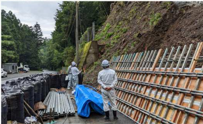
安全パトロールによる現場指導

袋井土木事務所では、平成28年度に「事故撲滅プロジェクトチーム」を立ち上げ、工事事故防止に向けた様々な対策に取り組んでいます。