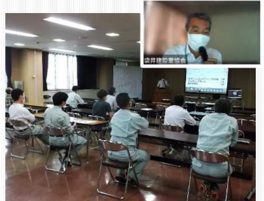
業者向けに建設業協会での安全講習会を実施 (一部はリモート参加)

中でも、事務所発注工事で発生した事故内容、再発防止策等を掲載した「工事事故対策通信」は、平成30年1月から配信を開始し、これまでに累計38通を発行。