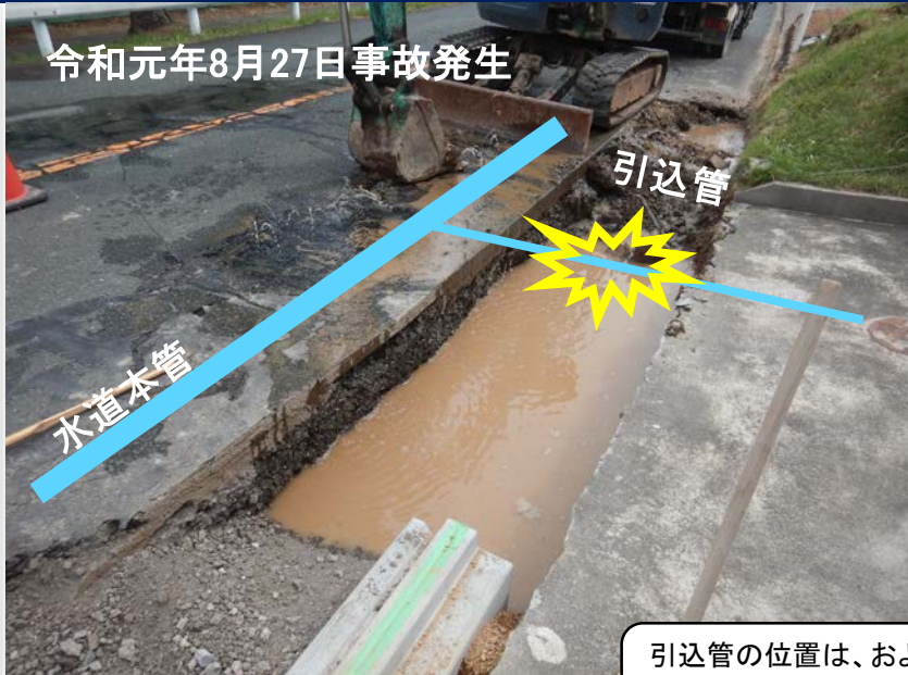
令和元年8月27日事故発生