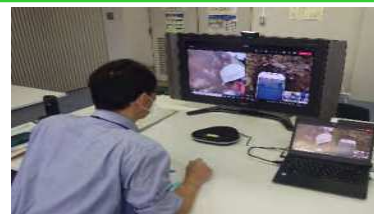
技術者が、カメラ映像を確認し、現場へ指示

・公共工事発注者への 施工体制台帳 の 提出義務 を 合理化 (ICTの活用で施工体制を確認できれば提出を省略可)