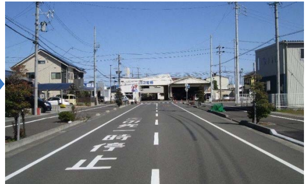
都市計画道路の開通とあわせ歩道を整備し、自転車や歩行者が安心して通行できる住環境を整備