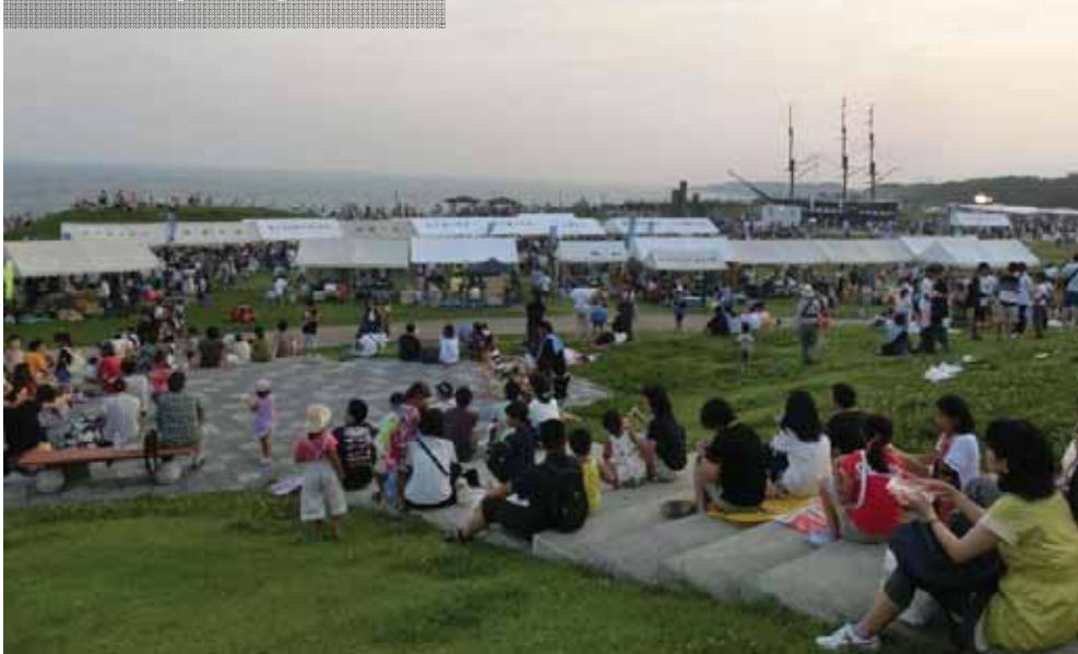
田子の浦みなと祭