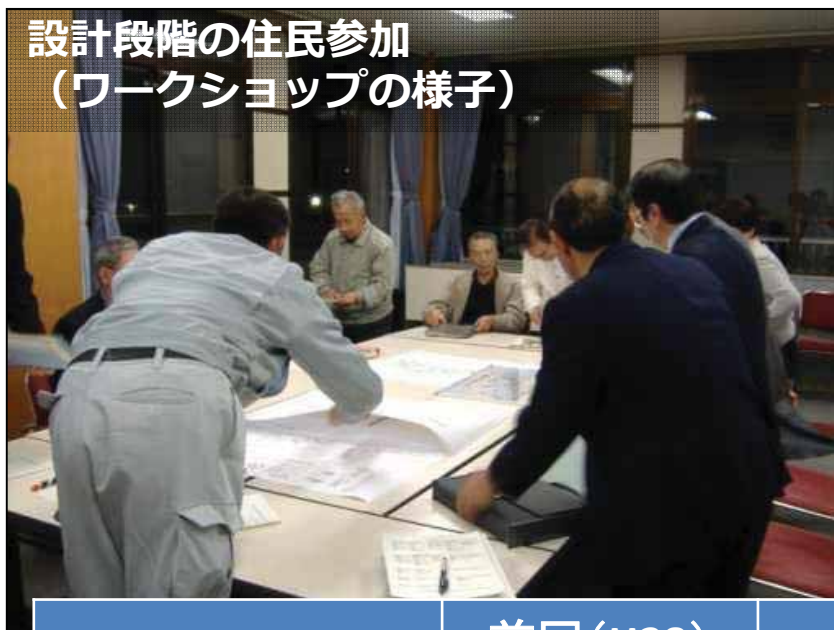
設計段階の住民参加 (ワークショップの様子)