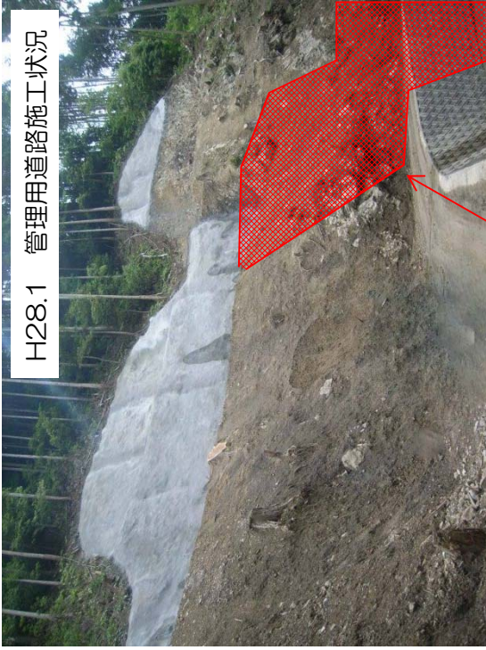
H28.1 管理用道路施工状況

溪流名： 伊太谷川支川 静居寺沢 箇所： 島田市 伊太 地先 事業期間： 平成24～31年度 事業費： 220百万円 事業量： 砂防堰堤工 2基（不透過型） 高さ7.5m 堤長34.0m 堤体立積1,070m 3 （本川） 高さ10.0m 堤長39.0m 堤体立積1,411m 3 （左支川） 計画貯砂量 12,198m 3