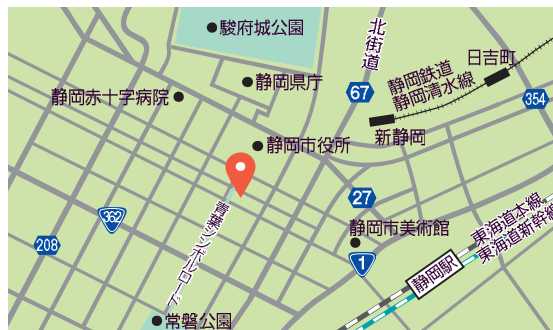
アクセス / JR 静岡駅北口、静岡鉄道新静岡駅から徒歩 10 分

オリジナル企画展「しぞーかのこどもっち」は、2022 年の今年、5 年目を迎えました。障害のある子どもたち手作りの雑貨販売のほか、アート作品を開放的でゆったりとした店内の色々な場所に展示。子どもたちの自由な発想のアートに触れて障害のある方への理解を深めてほしい、誰もが輝ける世の中になってほしい、との願いを込めて企画を続けています。子どもたちのアート作品で三保原屋 LOFT オリジナルグッズも作っています。