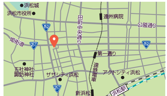
アクセス / JR 浜松駅北口から徒歩10分、遠州鉄道第一通り駅から徒歩7分

街のにぎわいづくりに貢献する取組として、はままつ街みつプロジェクト「ハチとミツのおいしい休日」も期間限定イベントとして実施。「はままつ街みつ」は、近隣ビルの屋上で採取したはちみつで、想定以上の量が採れたことに感謝し、企画。街中の徒歩圏内にある飲食店、菓子店の協力店に「はままつ街みつ」を配り、イベント期間中は、各店舗が「はままつ街みつ」を使ったオリジナルメニューを提供しています。