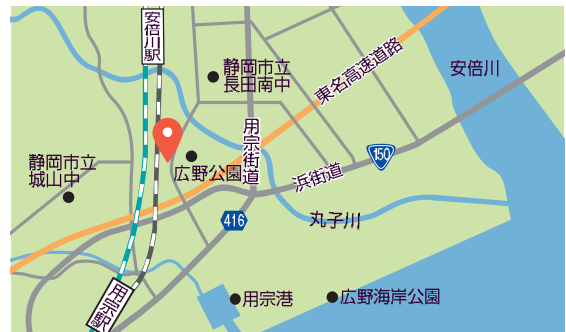
アクセス/東名静岡IC、東名焼津ICから車10分、JR安倍川駅から徒歩14分

果汁感が残るドライフルーツも開発、商品化。自然素材を用いたパッケージで「そのまま、そのまま。」旬の味を届けています。