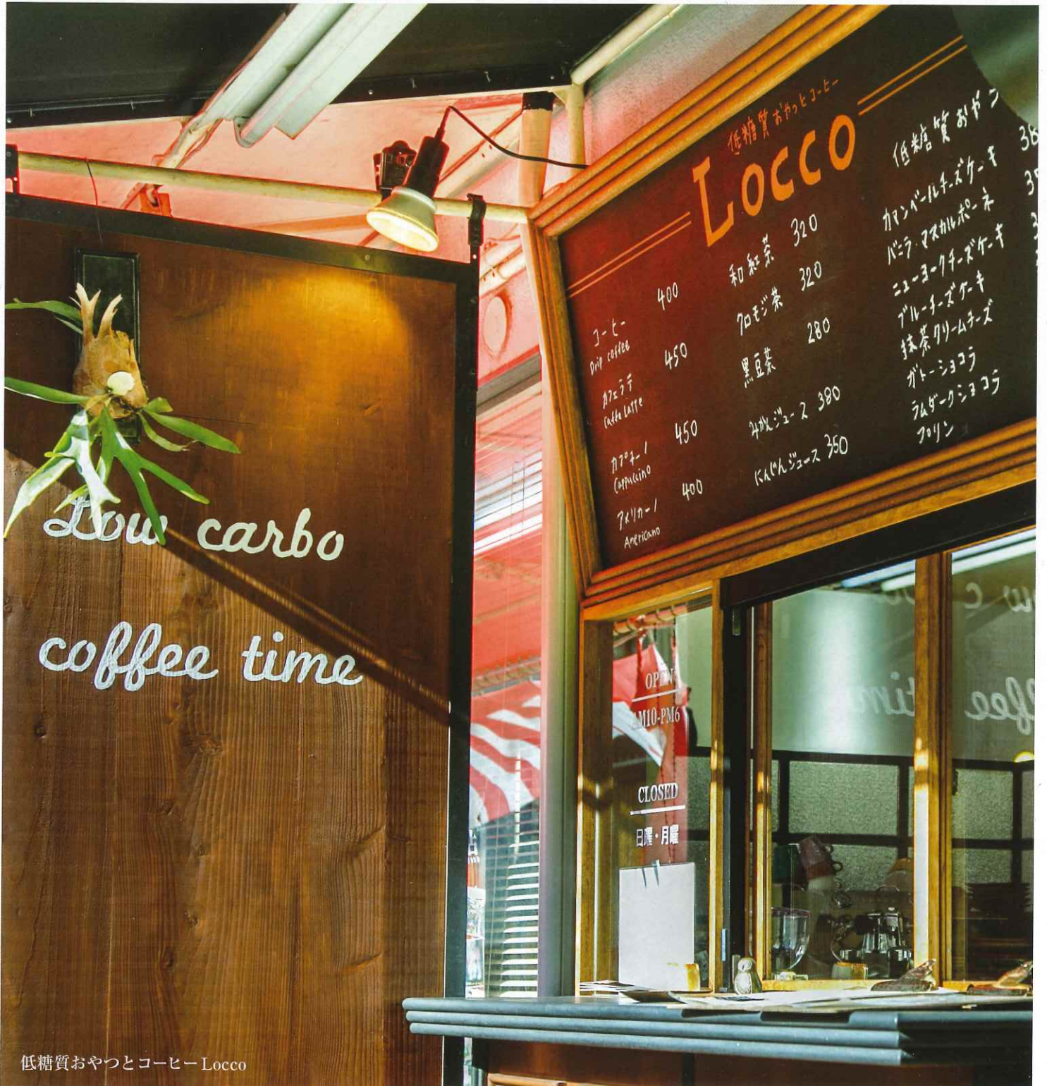
低糖質おやつとコーヒー Locco