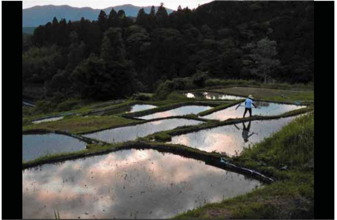
「久留女木棚田代かき風景」 撮影地：浜松市北区引佐町西久留女木 久留女木の棚田～竜宮小僧伝説の邑～