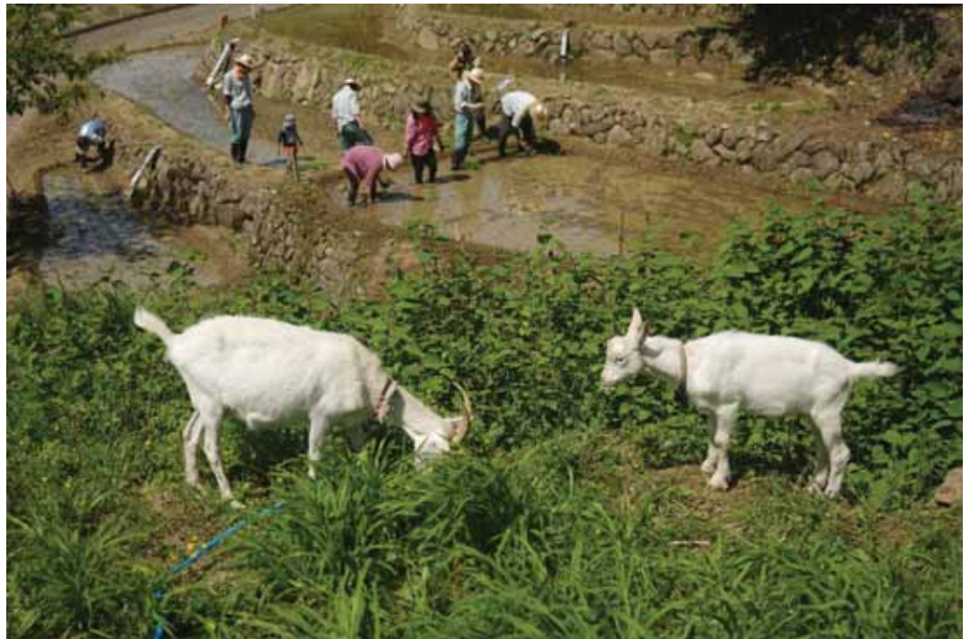
「休日のひととき」 撮影地：賀茂郡松崎町 (石部赤根田村百笑の里)