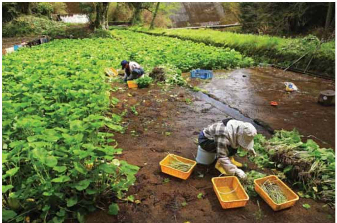
一般部門 「山葵収穫」 撮影地：伊豆市上船原 (日本一水わさびの邑)