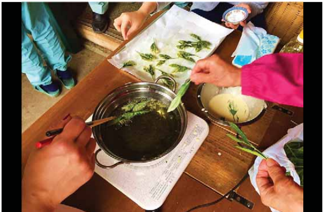
「新鮮なうちに」 撮影地：静岡市葵区足久保奥組 (奥長島 (足久保))