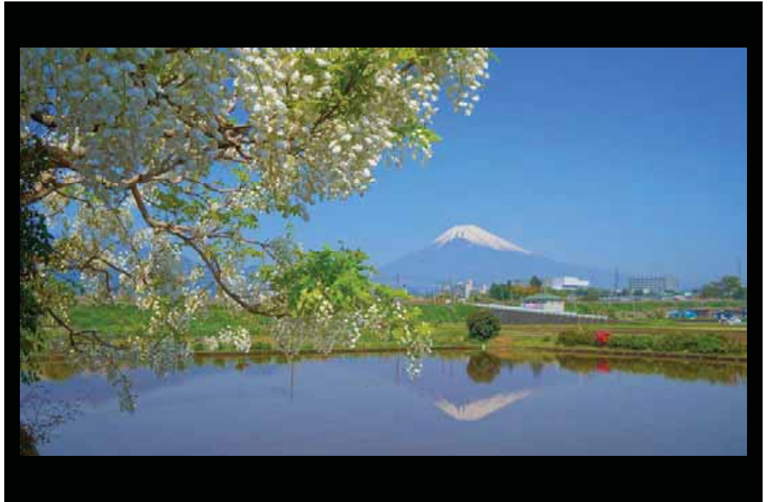
邑づくり特別賞 「南駿の春景」