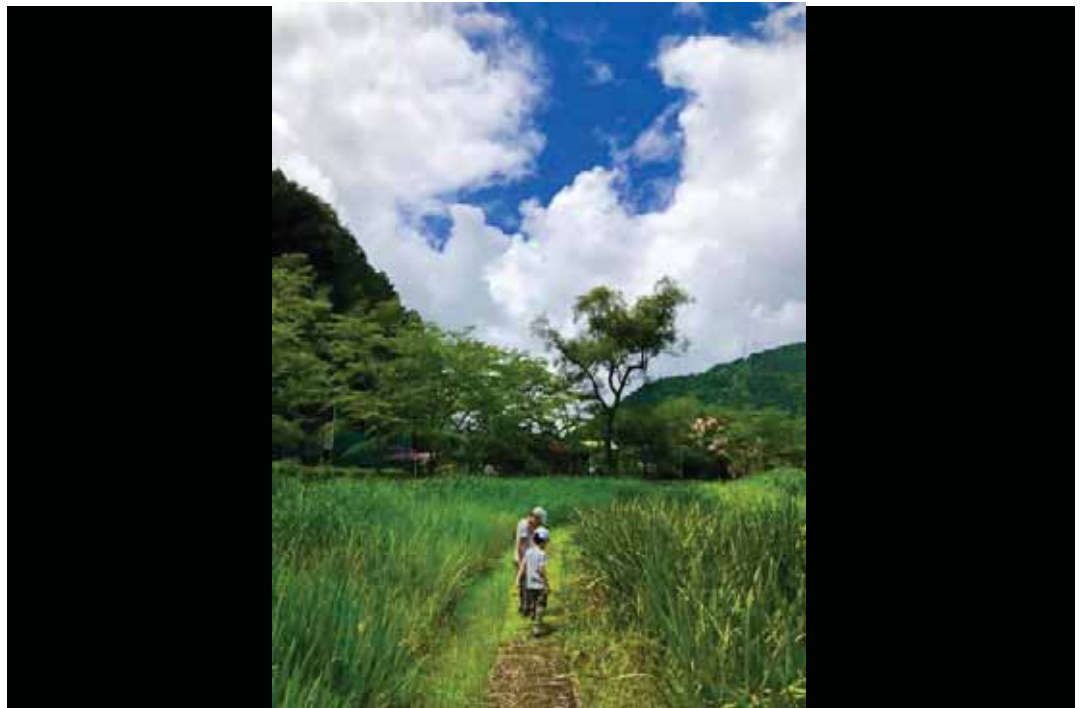
SNS 部門 「夏到来」