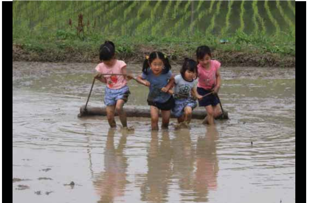
一般部門 「農業体験」