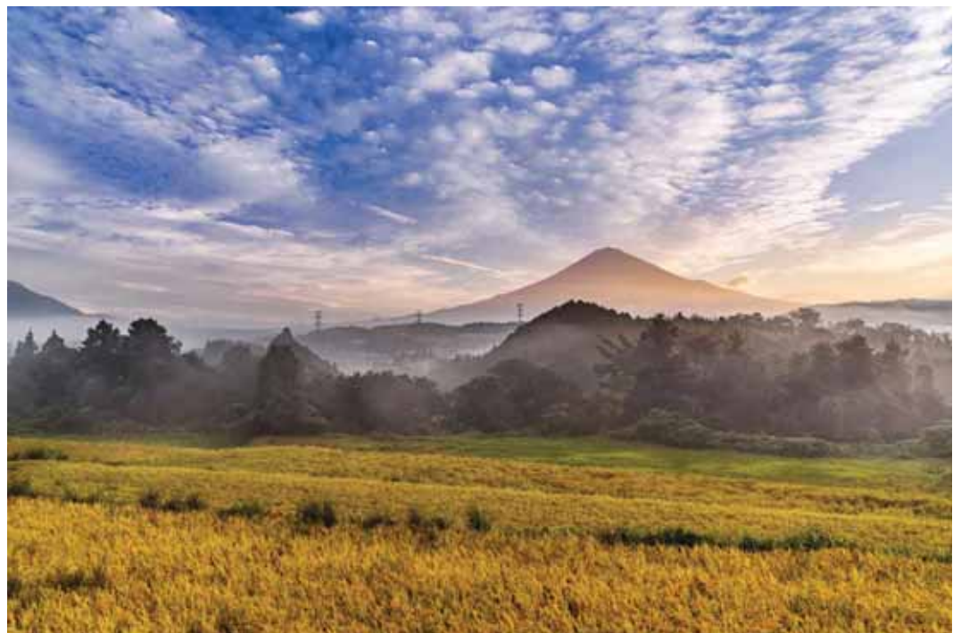
邑づくり特別賞 「秋色の幻想郷」