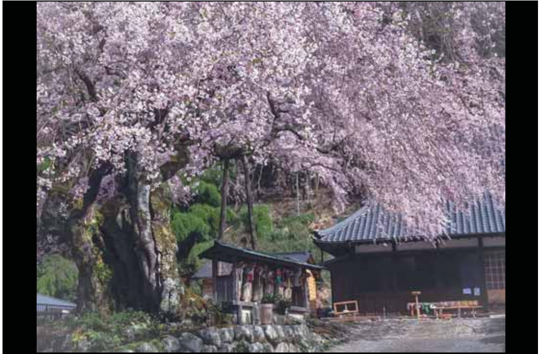
SNS 部門 「悠久の桜」