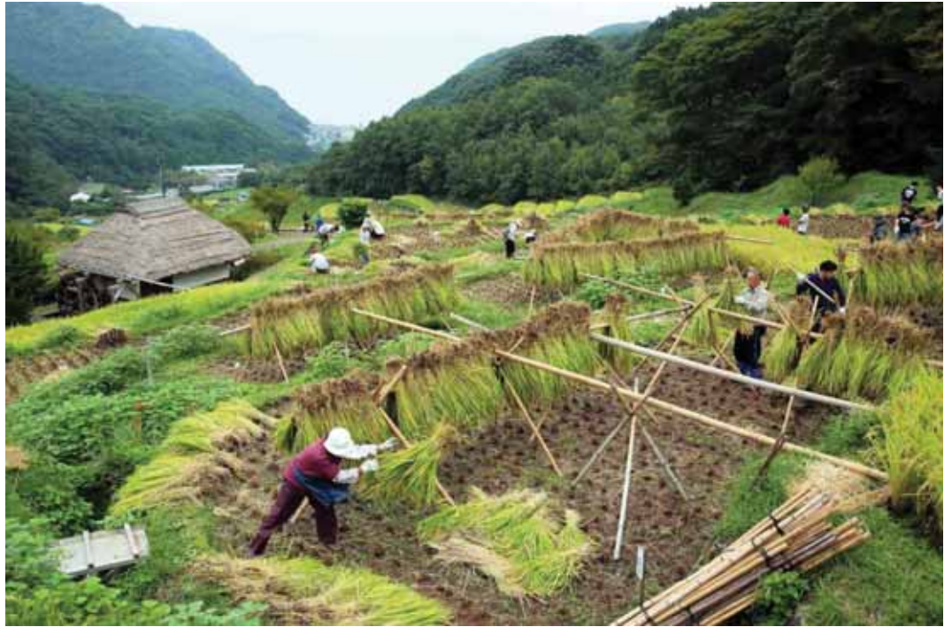
一般部門 「棚田の実り」