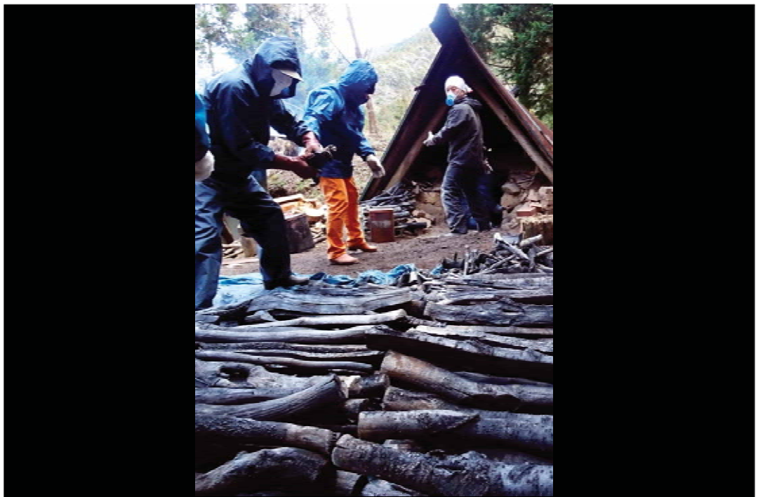
邑づくり特別賞 「炭焼き」