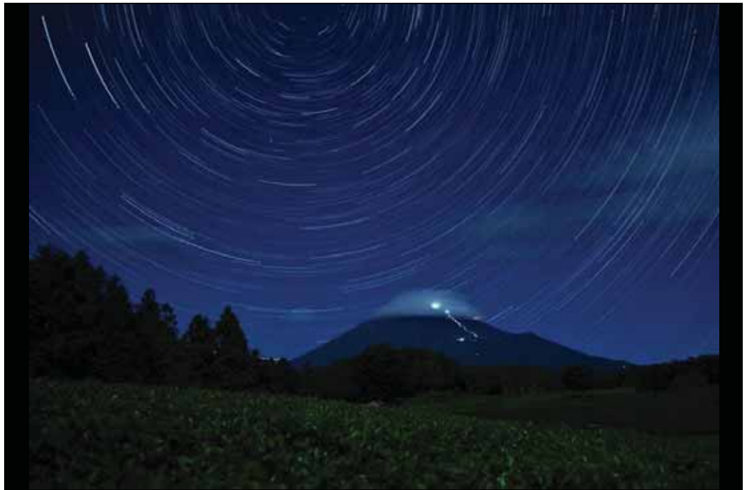
SNS 部門 「真夏の夜の茶畑」 撮影地：富士市大淵笹場