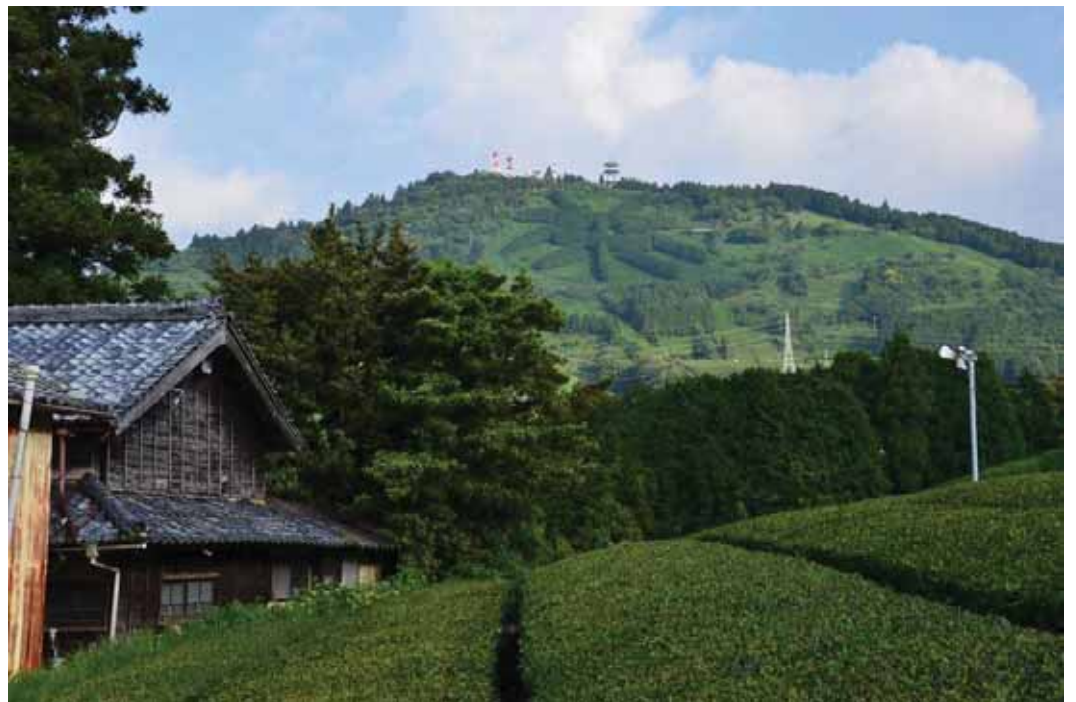
SNS 部門 「茶文字の栗ヶ岳」