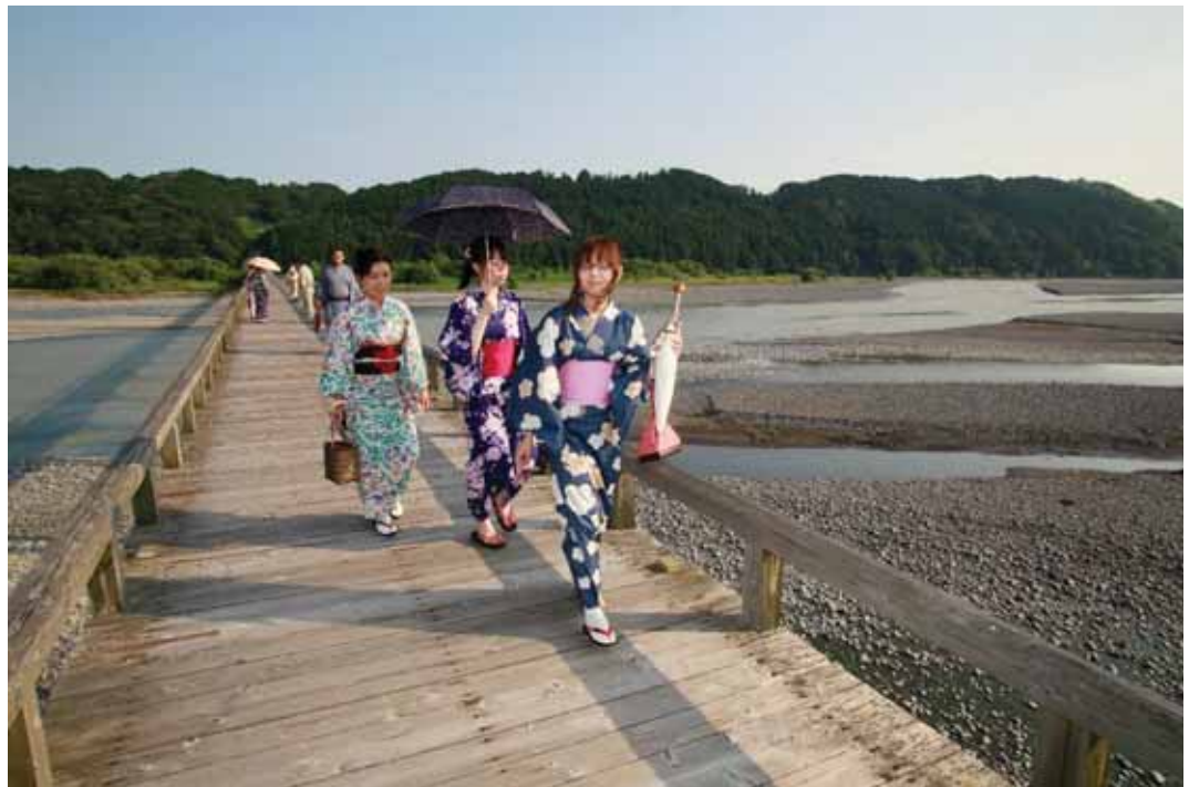
「川風を感じて」 撮影地：島田市南町