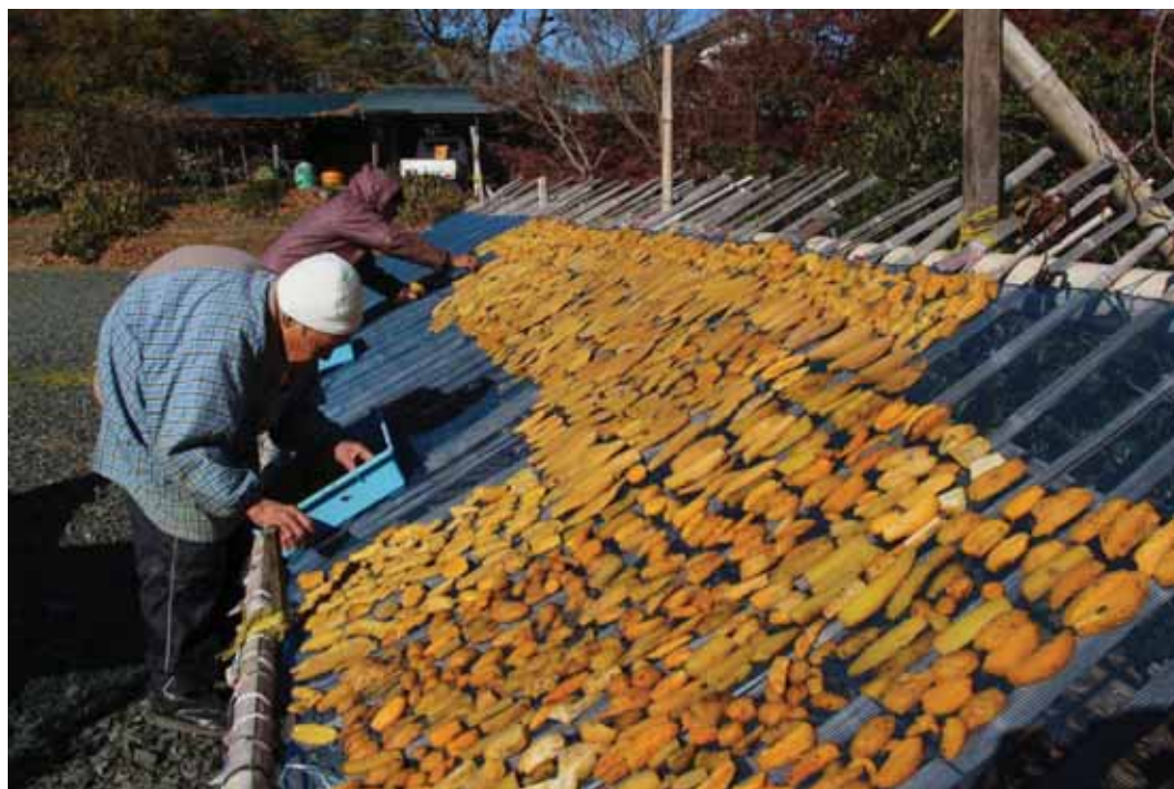
一般部門 「冬の風景 (干いも)」 撮影地：湖西市白須賀