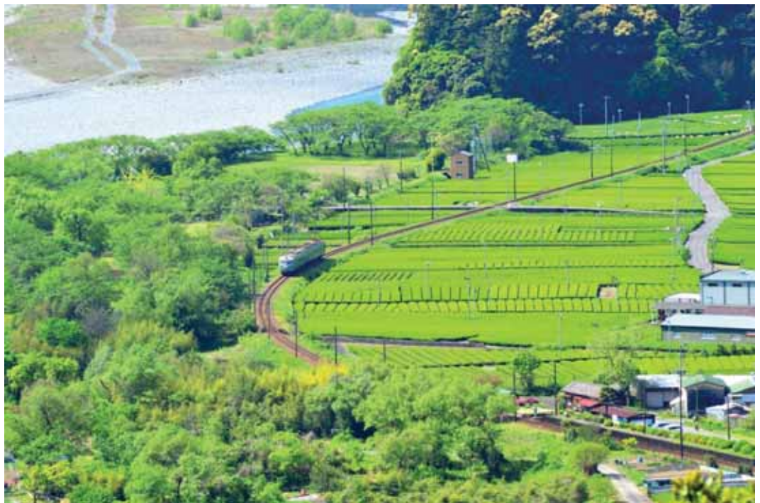
邑づくり特別賞 「新茶色の世界」