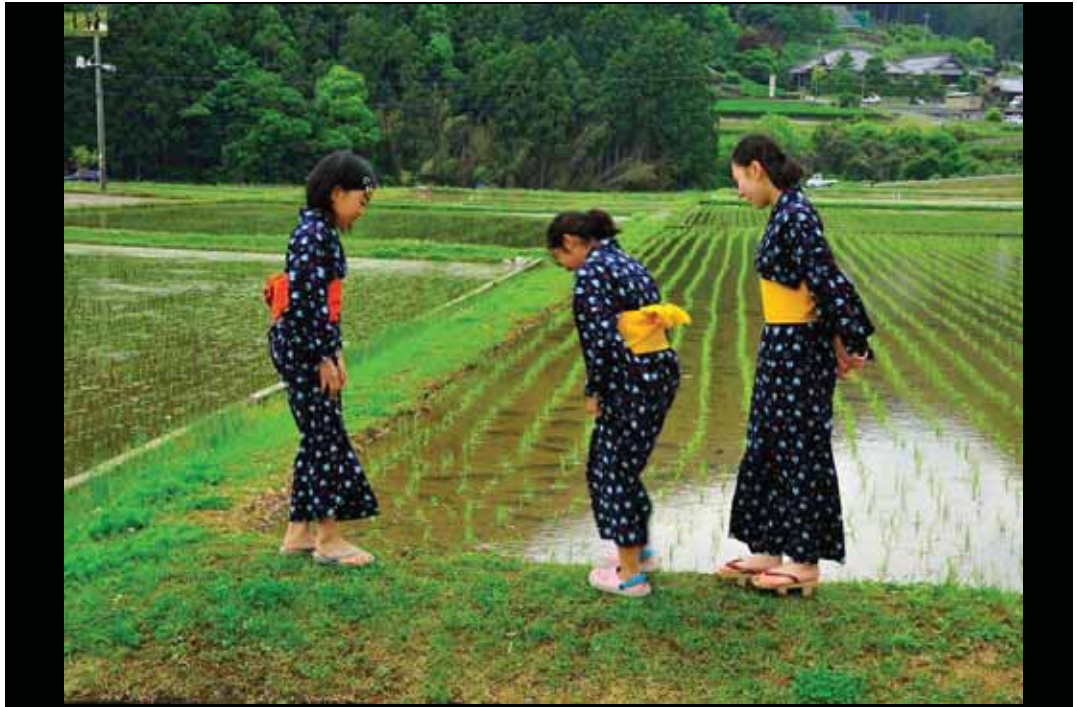
SNS 部門 「お揃いで」