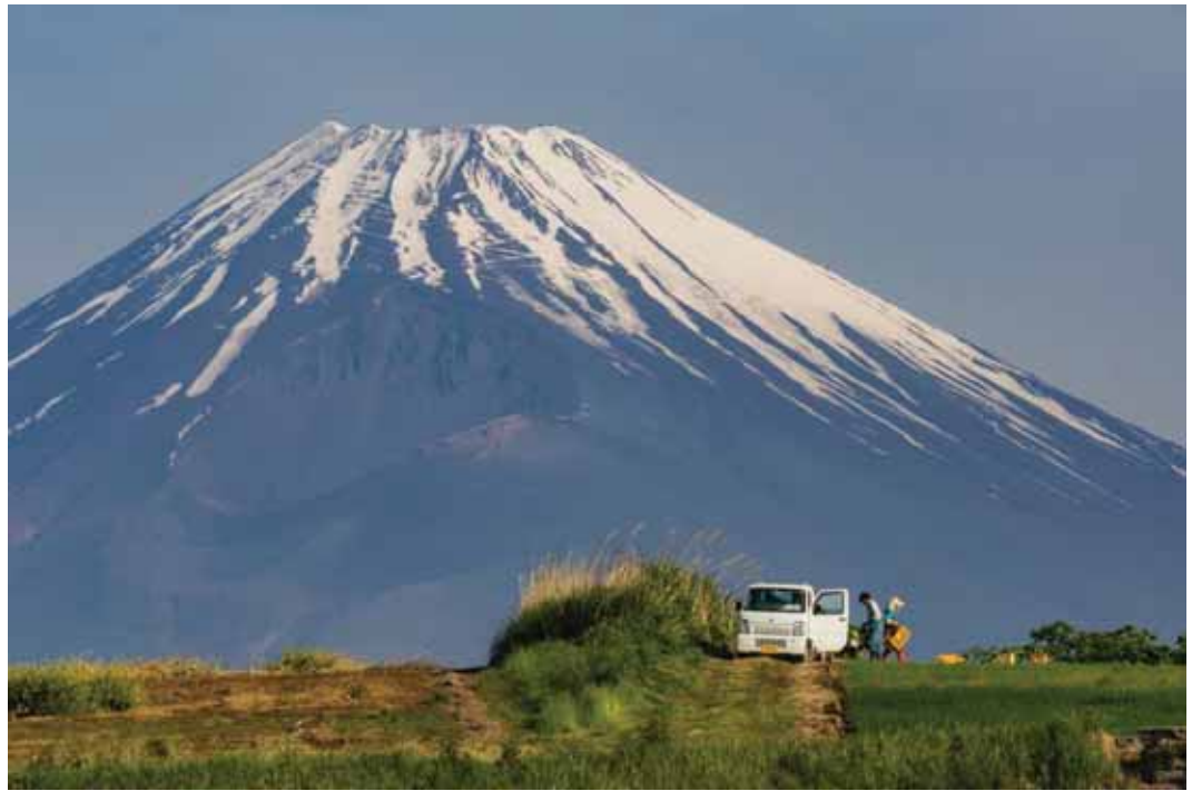
一般部門 「富士に見守られて」 撮影地：三島市玉沢 (三島箱根西麓地区)