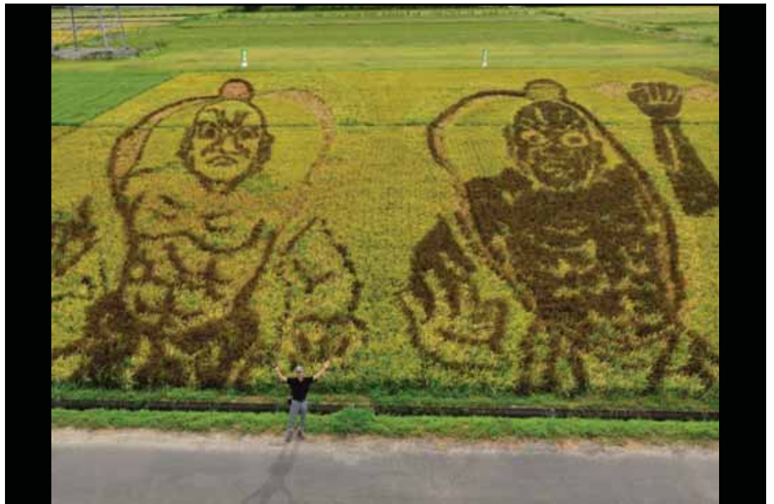
一般部門 「仁王出現」