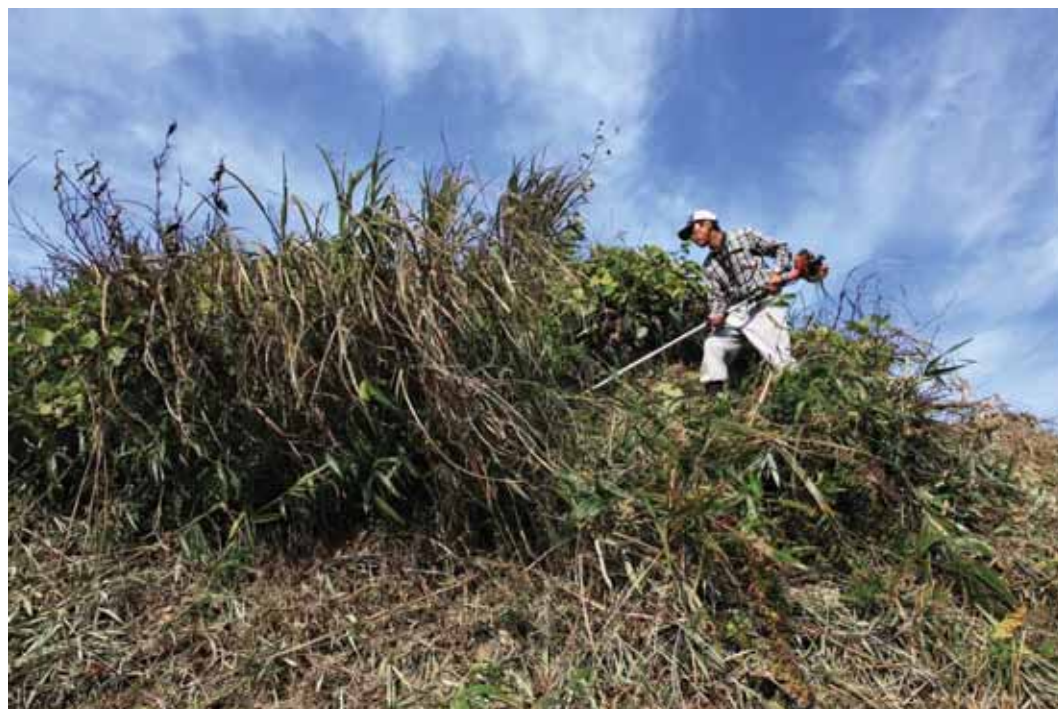
一般部門 「茶草刈る」 撮影地：掛川市五明