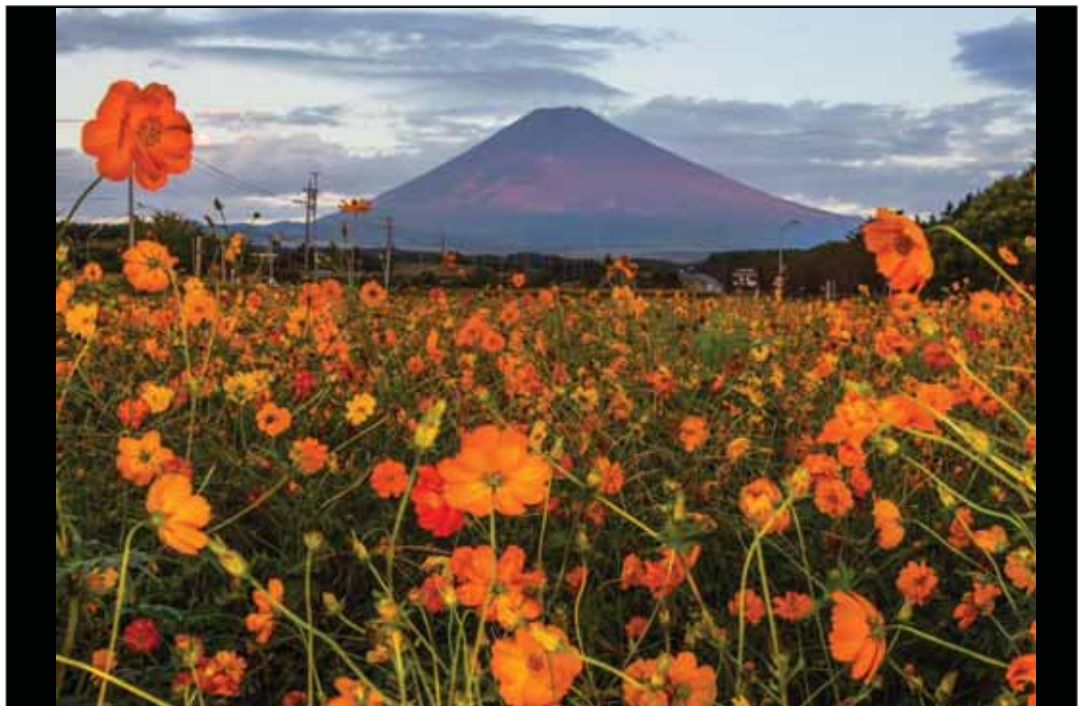
邑づくり特別賞 「朝日を受けて」