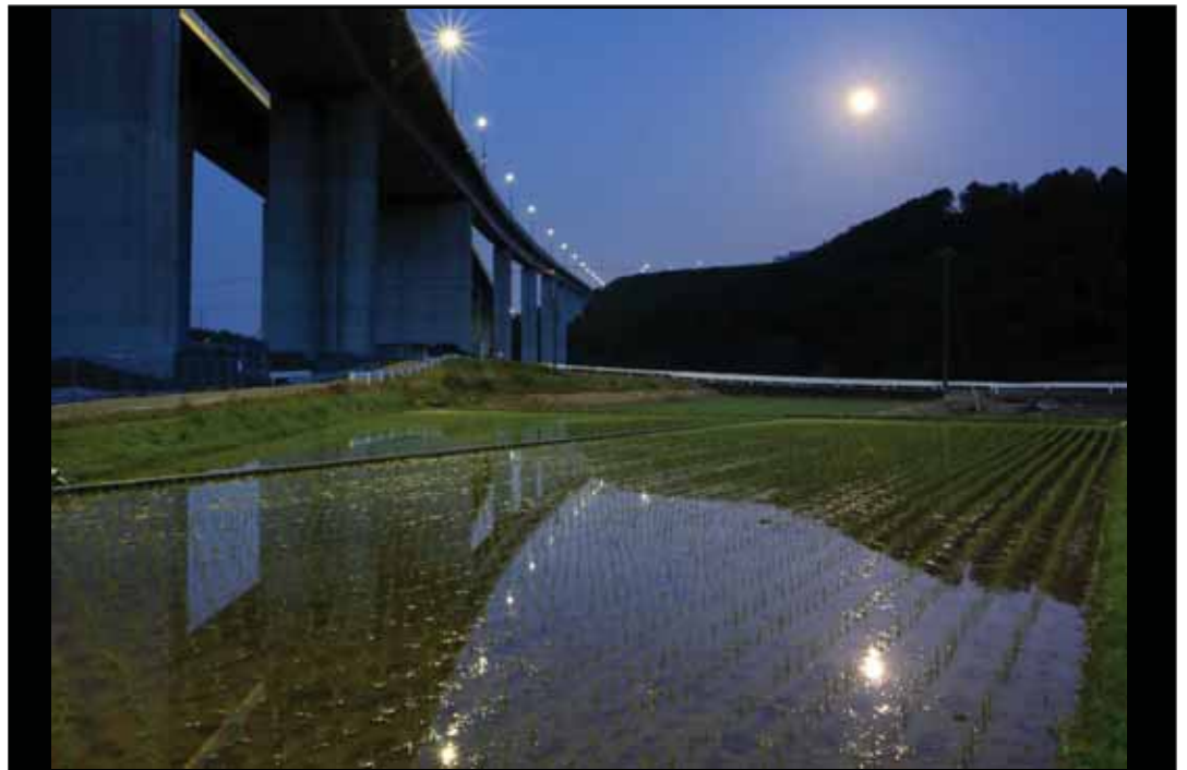
「満月に輝く田んぼ」