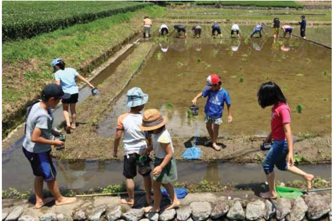
邑づくり特別賞 「田植え」