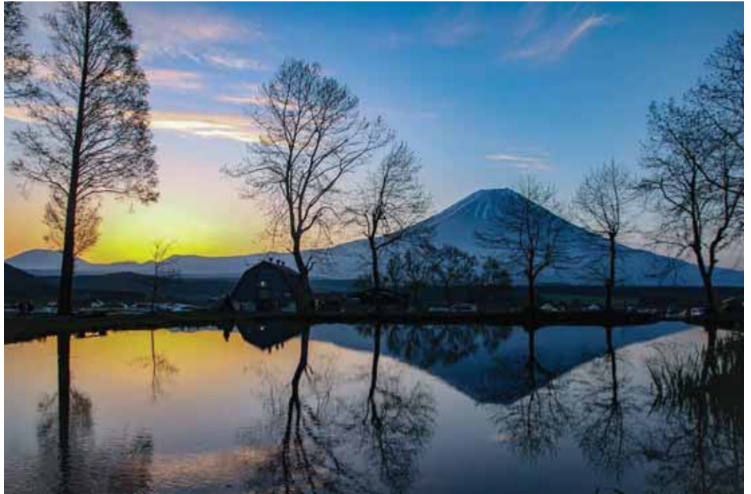
「キャンプ場の朝」 撮影地：富士宮市麓