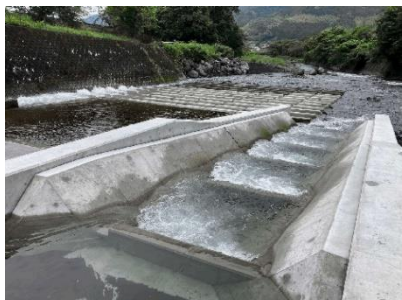
魚道（本工事で新設）

富士農林事務所では、一級河川富士川水系芝川から富士宮市南部の水田156haにかんがい用水を供給している安居山用水の起点「燕頭首工」の堰改修工事を実施しています。