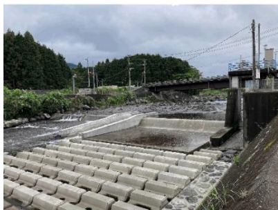
魚道、堰本体、上下流護床ブロック