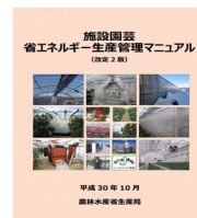
▲省エネマニュアル