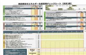
▲省エネチェックシート