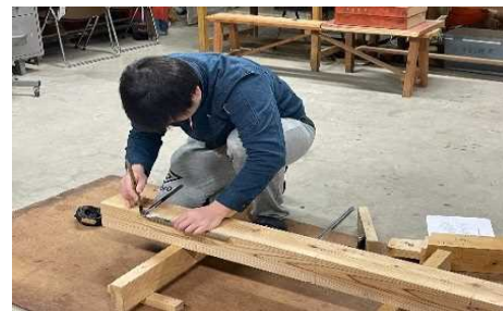
墨付け作業から学びます