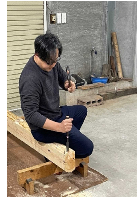
手作業で加工します