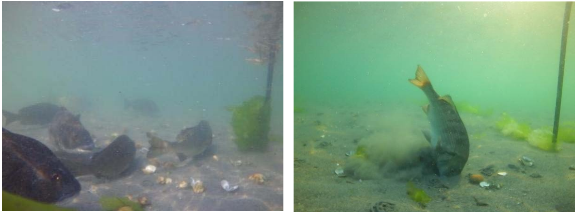
図 1 湖底に群がるクロダイ (左)・砂中のアサリを捕食するクロダイ (右)