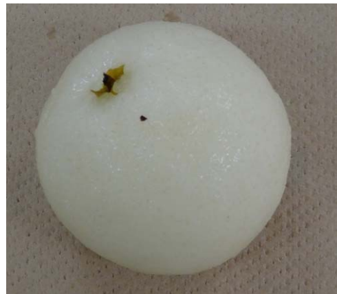
写真 本技術を活用し手ではく皮中のカキ「次郎」(左)と剥皮したニホンナシ「豊水」(右)