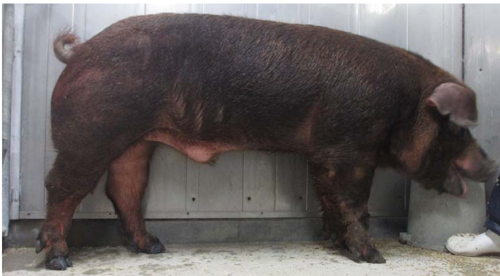
図 1 完成したデュロック種「フジロック 2」