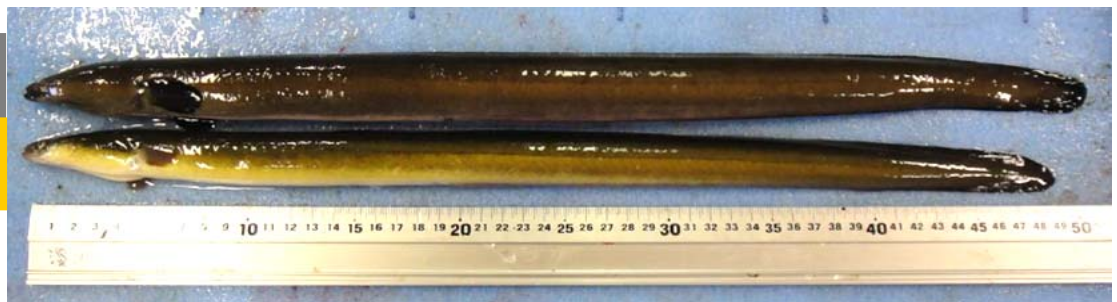
写真 銀ウナギ(親ウナギ:上)と黄ウナギ(下)の体色の違い(親ウナギは金属的な黒褐色となる)