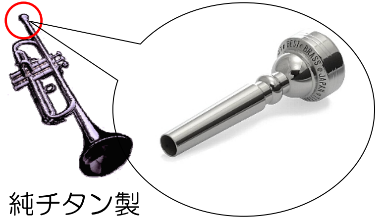
純チタン製 管楽器用マウスピース

トランペットなどの 管楽器では、金属製マウス ピース(口に直接触れる部 分)でアレルギーを起こす ことがあります。