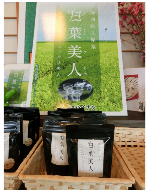
共同研究した JA ハイナンが白葉茶を商品化