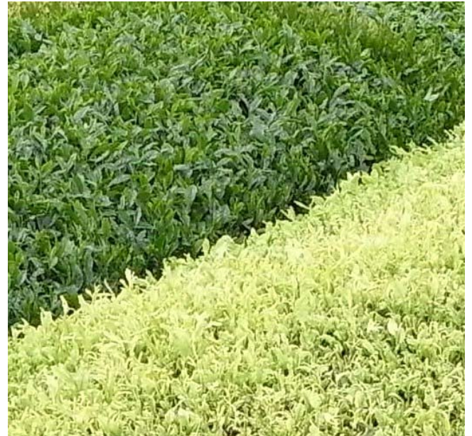
強遮光で新芽が白葉化 (右下) 適度な遮光で新芽が濃緑化 (左上) ※同じお茶の樹

うまみ せいぶん さん 旨味成分(アミノ酸)が つうじょう りよくちゃ ばい 通常の緑茶の2~3倍 そうか に増加