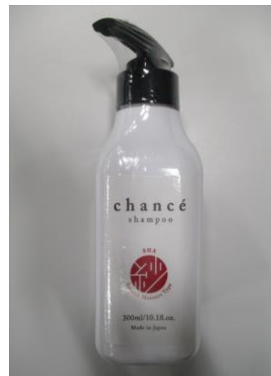
(13) シャンセ シャンプー 紗