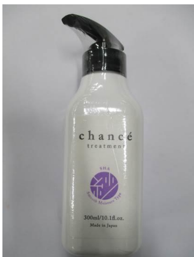
(14) シャンセ トリートメント 紗