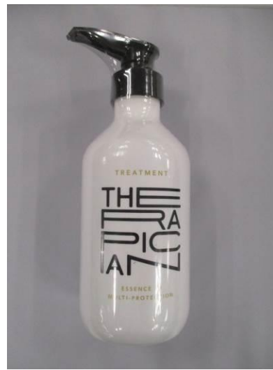
(11) Therapician Treatment