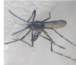
ヒトスジシマカのメス