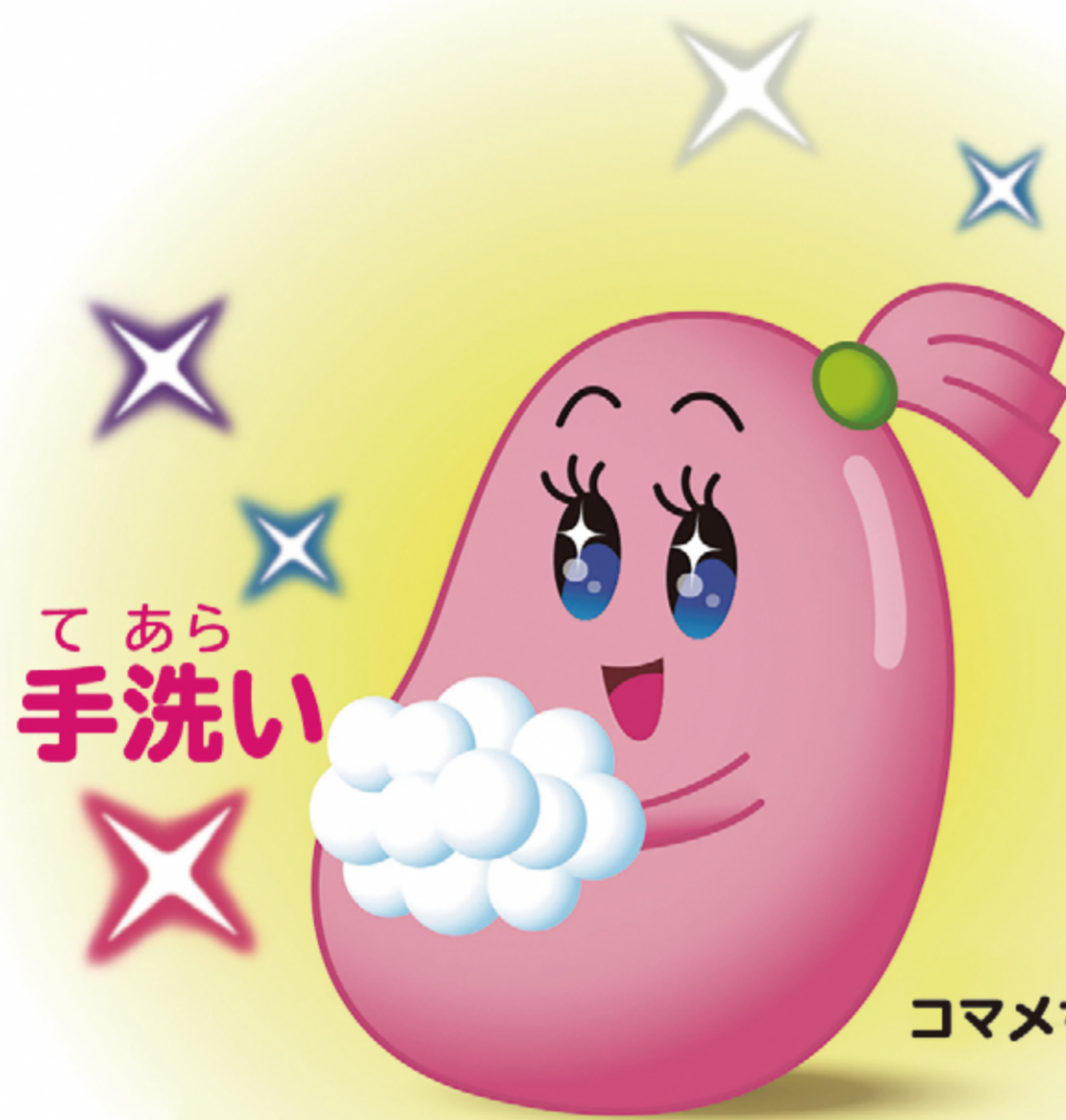
コマメちゃんとマメゾウくん

マメ て な あら 手洗いと咳エチケット せき で 「かからない」、「うつさない」。