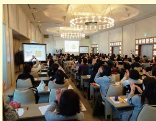
手話通訳者等健康管理講習会