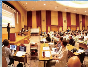
ろう教育静岡フォーラム