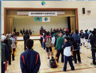
県ろうあ者体育大会