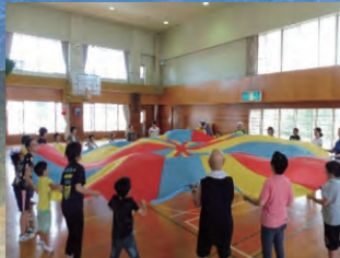
赤い羽根共同募金受配 夏休みろう子どもクラブ