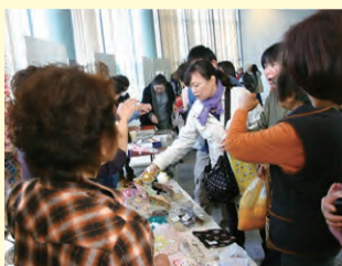
県ろうあ女性のつどい