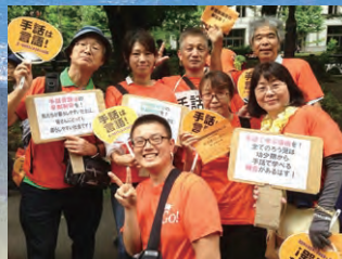
手話言語条例集会