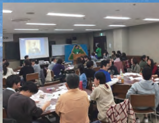
県ろうあ者青年のつどい