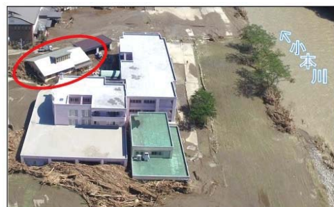
平成28年台風10号により、岩手県の要配慮者利用施設では利用者9名の全員が死亡。