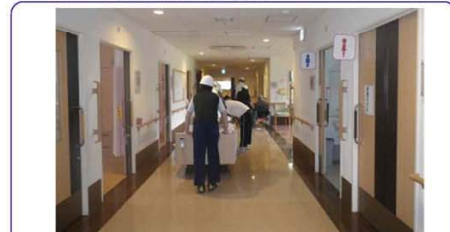
令和元年6月同施設での避難訓練実施状況