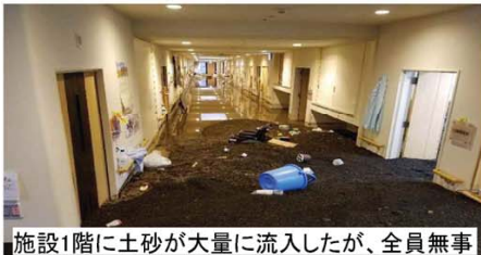
施設1階に土砂が大量に流入したが、全員無事