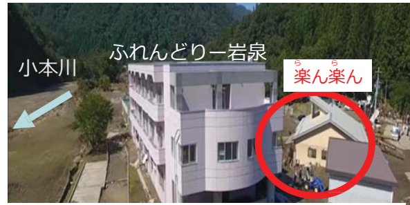
写真)「平成28年8月岩手県岩泉町の介護老人保健施設の被災動画」

○平成28年8月30日の台風第10号の雨による岩手県小本川の水害で「グループホーム 楽ん楽ん」で入居者9名が亡くなる大きな被害が発生