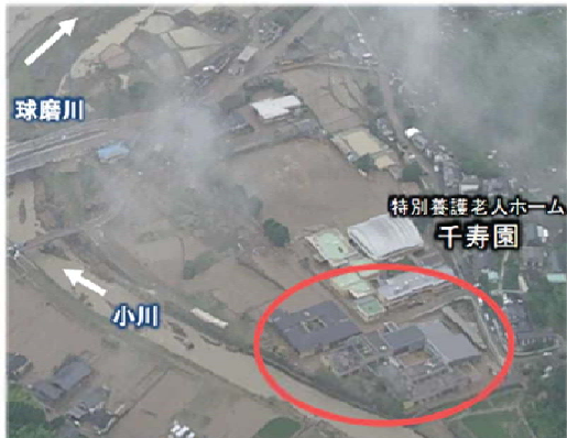
被災場所: 熊本県球磨村