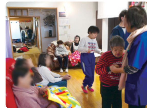
リビングでくつろぐ利用者さん。高齢者さんの「助っ人」も大活躍!

「池ちゃん家」ではデイサービスや短期入所を利用している高齢者が障害のある人をあれこれ世話をしてくれます。同じ敷地に立つ高齢者向けと障害のある人向けの2つのエリアを行ったり来たり。最初はぎこちなかった高齢者も、時間と場所を共有するうちに慣れてきて、声をかけたり見守ったりする役割にやりがいを感じてくれるようになりました。平成25年から障害のある人向け短期入所が始まり、スタッフも夜間は高齢者・障害のある人の両方をみるようになって、利用者の情報を共有できるようになりました。民家をそのまま使った施設は、アットホームな雰囲気、地域の方がボランティアでフラダンスや踊りを披露し、利用者を巻き込んで踊ったり歌ったり。「池ちゃん家」は利用者、スタッフ、地域のボランティア団体、ジョブコーチなど様々な人が関わることで、今日もにぎわっています。