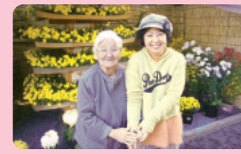
利用者スタッフ、そして年齢の差を超えて、心がつながります。