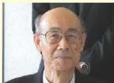
角替 弘志 静岡大学 名誉教授