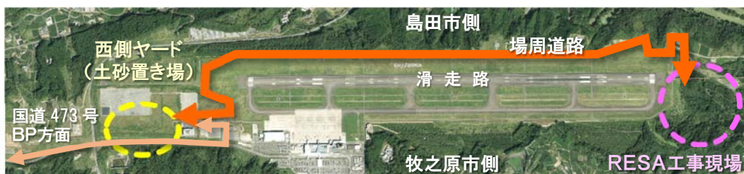
RESA工事位置図 ・ 運搬経路図