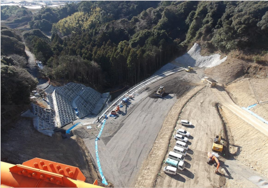
RESA整備工：上載盛土1段目施工中