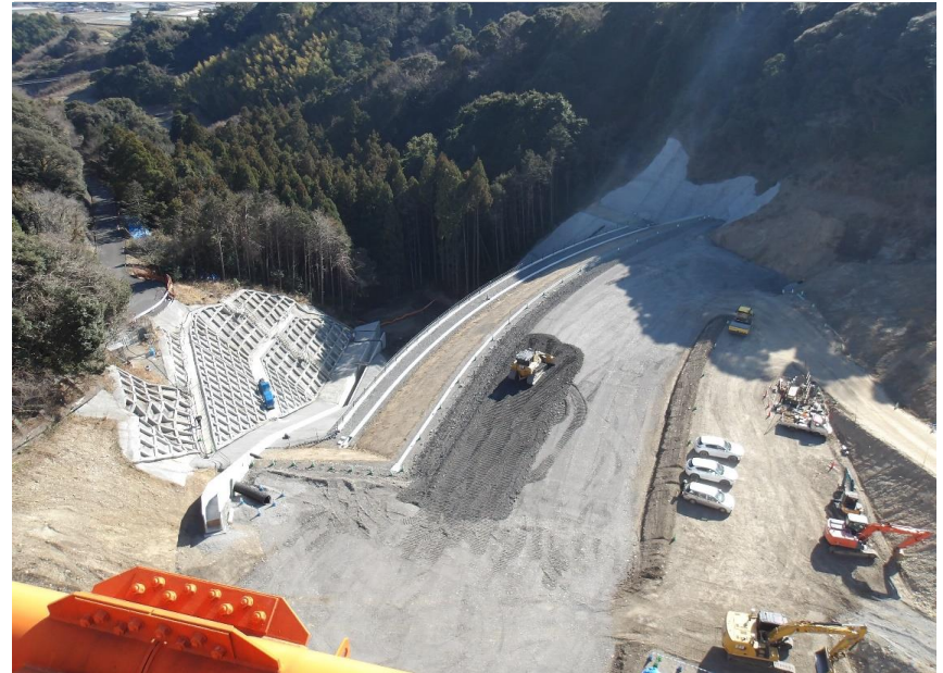
RESA整備工：上載盛土2段目施工中