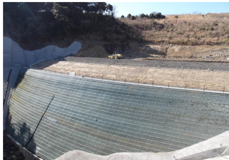
RESA整備工：上載盛土2段目施工中