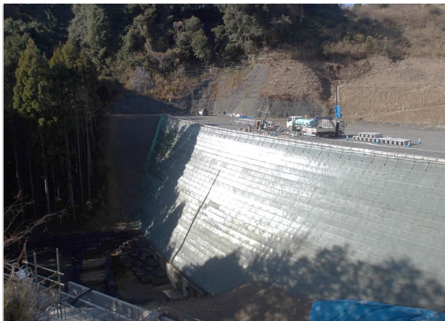
RESA整備工：上載盛土工事の着手に向けた事前準備中