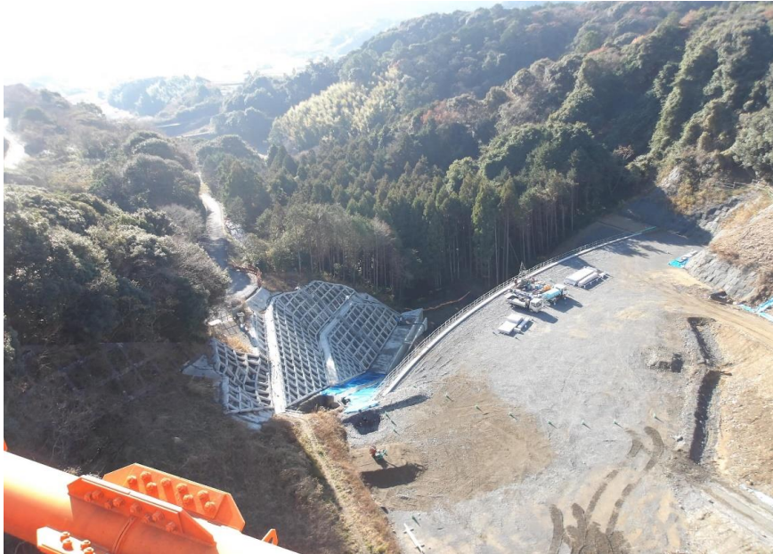
RESA整備工：上載盛土工事の着手に向けた事前準備中