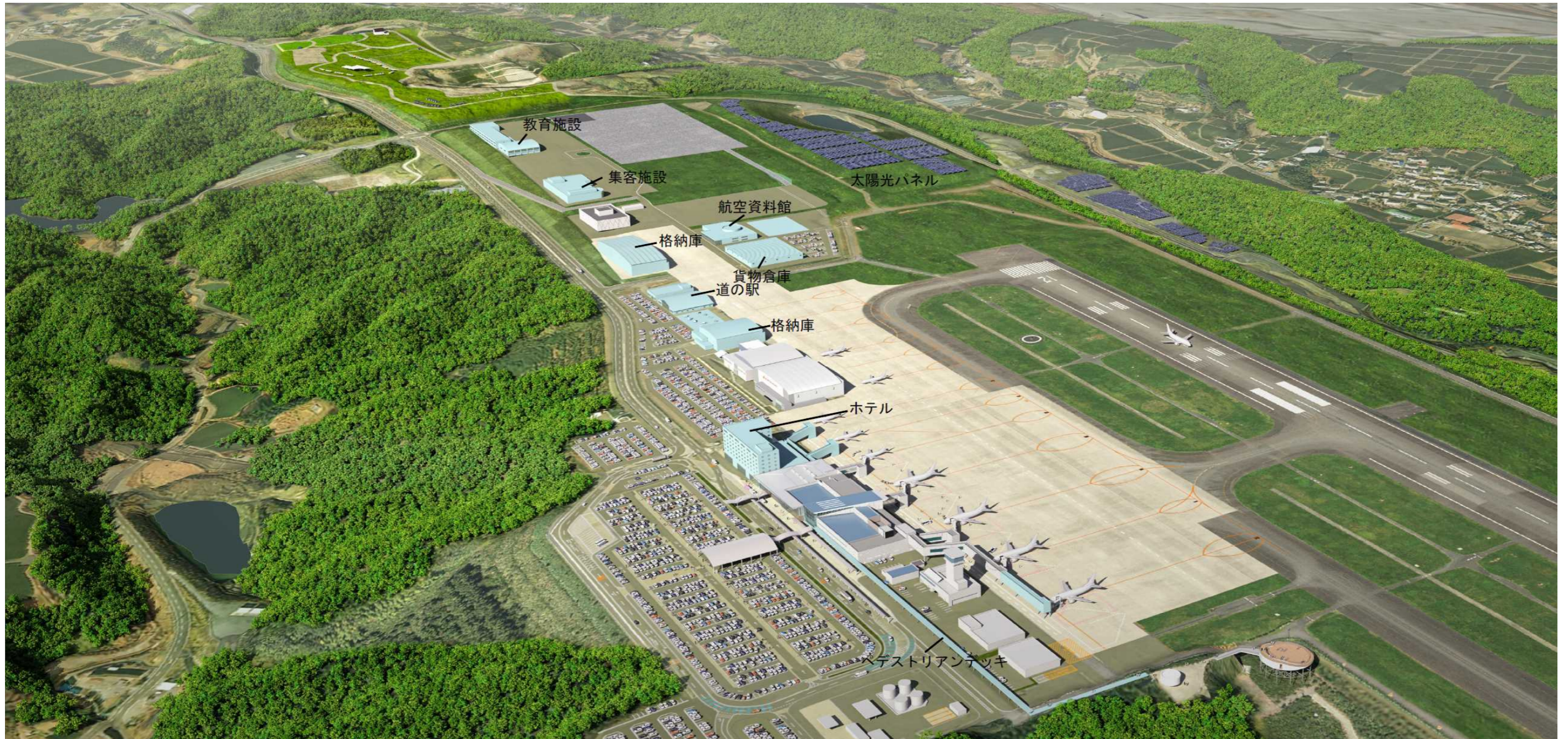
このイメージパースは静岡県が目指す姿を描いたものです。