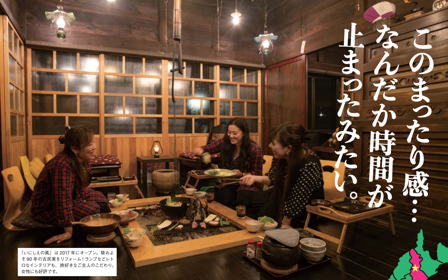
『いにしえの風』は2017年にオープン。築およそ90年の古民家をリフォーム！ランプなどレトロなインテリアも、旅好きなご主人のこだわり。女性にも好評です。