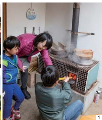
1 かまどでお米を炊く体験は子どもにおすすめ。湯気の香りがしあわせ…！2) 料理の素材はほとんど自家製。夕食はお問い合わせを。3) 辺りは眺めも見事な田園地帯。二子湧水へは徒歩20分。