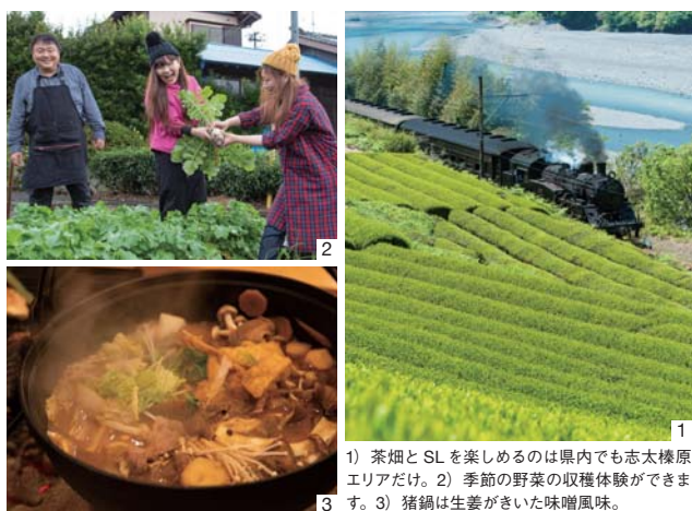
1) 茶畑とSLを楽しめるのは県内でも志太榛原エリアだけ。2) 季節の野菜の収穫体験ができます。3) 猪鍋は生姜がきいた味噌風味。