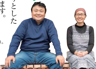
→『いにしえの風』を営む猪又さんご夫婦は旅やキャンプが大好き。志太榛原のおすすめの旅を教えてください。

茶畑の中を走るSLと、農作業の手を止めて列車に手を振る地元の人々。そんな心む風景が日常の志太榛原エリア・川根地域。『いにしえの風』は大井川本線地名駅の正面にあり、大井川鐵道のSLや電車が目の前を走る人気の民宿です。ここへはぜひ一度、大井川鐵道で訪ねてみてください。昭和時代の木造駅舎や踏切の音が、ほかにはないゆったりとした気分させてくれます。囲炉裏を囲んでいただく郷土料理も絶品。ご主人と一緒に川根伝統の鯖出汁とろろ汁を作りながら、鍋が煮えるのを待つ時間は格別です。近くの山から見下ろす日の出や大井川の朝霧も見事。志太榛原の田舎時間を、ぜひ『いにしえの風』で味わってください。