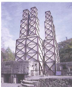
世界文化遺産登録を目指す「葦山反射炉」

1922（大正11）年、敷地も含めて国指定史跡となりました。現存する反射炉としては国内最古であるとともに、世界で唯一残っている実際に稼働した反射炉です。