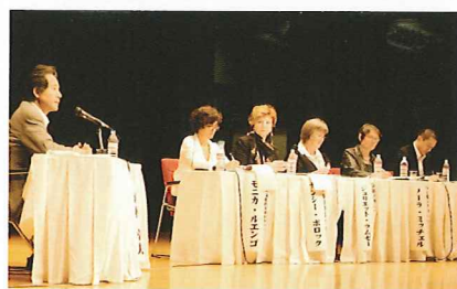
国際フォーラム(平成21年)