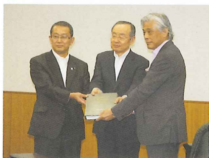
登録推薦書原案を文化庁へ提出(平成23年)