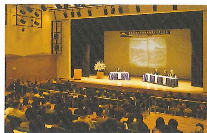
国際シンポジウム(平成20年)