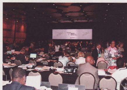
第34回世界遺産委員会

日本に関連のあるものとしては、第五福竜丸が被爆したマーシャル諸島の「ビキニ環礁」が世界文化遺産に登録されました。広島島の「原爆ドーム」に続き、「負の遺産」としての登録で、「核実験の威力を伝える上で、非常に意義深い証拠」と評価されました。