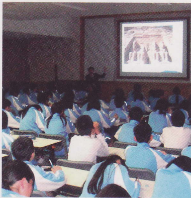
画像や映像を使用し、最新の世界遺産情報を提供します

富士山の自然や文化、世界遺産について学んでいただくために、専門知識を有した講師を派遣し、世界遺産の基礎知識や登録に向けての取組状況を解説します。昨年度は、小中高合わせて11校、約650人が受講しました。