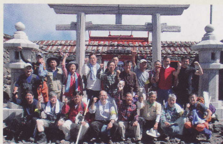
山頂奥宮で記念撮影

山頂の浅間大社奥宮では、神社職員から富士山の信仰と歴史についてのお話を伺い、富士山の神聖性と観光との調和について意見を交換しました。