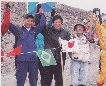
末広がりにちなみ、8月8日8時8分に互いに手を取り合う川勝知事(中央)

知事は、「途中きつかったが、美しい景色に慰められた。環境、自然保護の大切さを改めて実感した。登頂が一人の力ではできないのと同様に、静岡県と山梨県が一体となり世界文化遺産登録を実現したい」と抱負を語りました。