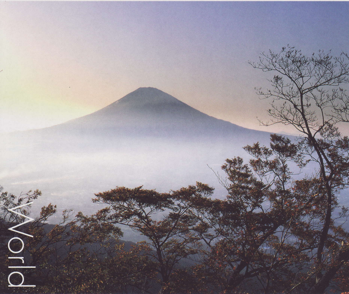
「秋の富士山（小山町）」