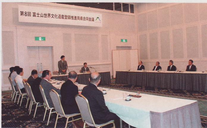
7月28日に開催された第8回富士山世界文化遺産登録推進両県合同会議

(1) 推薦書原案提出の先送りについて 推薦書原案は、7月初旬に開催した学術委員会の承認を得ており、さらに7月末までに内容の一層の充実を図った上で、文化庁への提出を予定していました。 ところが、推薦書原案の提出に必要な構成資産の国指定文化財について、富士五湖の指定に係る所有者などの同意取得作業が様々な要因で遅れたため、提出までに作業が完了する見通しが立たなくなりました。 また、富士山の保存管理の仕組みについても、広範囲に及ぶ富士山を適切に保存管理するための法令を所管する関係省庁間の合意が最終的に固まっていなかったことから、7月28日に開催した「第8