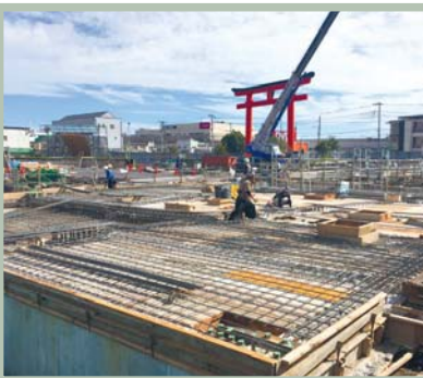
耐圧盤(基礎底盤)のコンクリートを打設しています。

8月には耐圧盤(基礎底盤)の鉄筋を組んでコンクリートを打設しました。 9月には基礎梁の鉄筋を組んでコンクリートを打設しました。 10月には、1階床の型枠を設置し、鉄筋を組み、コンクリートを打設しました。