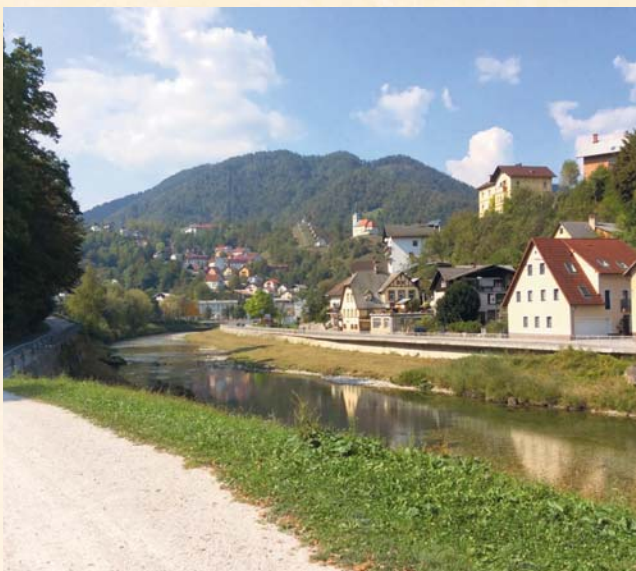
イドリヤ市とイドリヤ川

1990年代の鉱山閉鎖後も、このようなイドリヤの近代的伝統は町の経済活動で生きています。現在、イドリヤは、世界遺産の観光と共に持続性の高い新しい産業（電気製品の工場）に挑戦をしています。イドリヤは、人間と山の関係にとって、歴史だけではなく、未来の生活についても考えさせてくれる興味深い場所といえるでしょう。 (文化・観光部文化局教授 ハドソン・マーク) ※本コラムは2016年8月11日、富士宮市で行った公演をまとめたものです