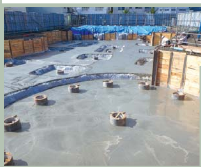
杭打設後に捨てコンクリートを打ち、いよいよ耐圧盤の配筋に入ります。

3月に着工した工事は、4月にかけて事前準備や現場事務所の建設を行いました。6月には既成コンクリート杭の打設を行い、7月には掘削、基礎配筋、コンクリート打設と、基礎工事を行いました。 また、現場事務所脇には外壁の一部のモックアップ(実物大模型)を作成しました。鉄骨下地組み、外壁材貼り、木格子設置と各段階の作業工程の確認や問題点の抽出をしています。