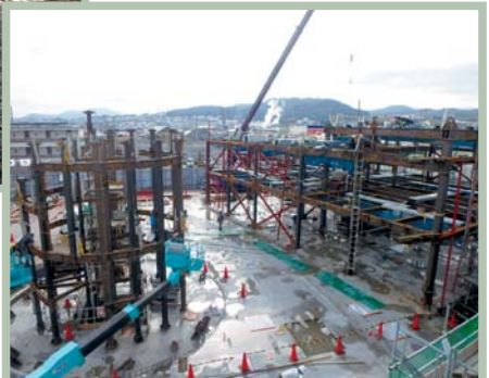
北棟のシアターの床鉄筋が組み終わりました。