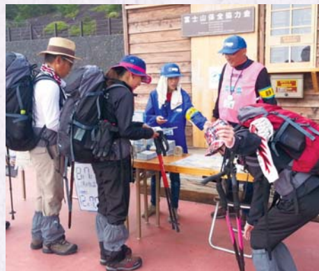
協力金受付の様子

昨年との比較では、協力者数で4,443人の増、金額では、3,069,868円の増となっています。協力率は、4.8ポイント増の51.5%となりました。