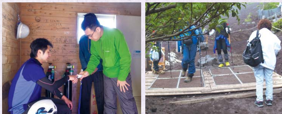
八合目衛生センター 外来植物防除マット設置状況(富士宮口)