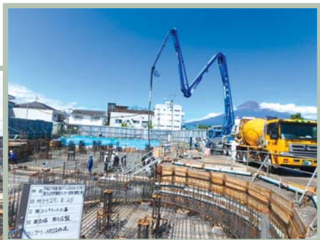
基礎梁のコンクリート打設が終わり、1階床の鉄筋を設置しています。