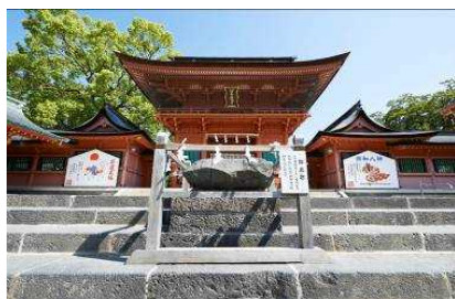
富士山本宮浅間大社 楼門・鉾立石