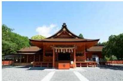
富士山本宮浅間大社