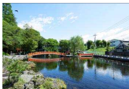
富士山本宮浅間大社 湧玉池

※移動方法は例示となります。また、移動時間等も実際の交通状況等により変動しますので御注意ください。