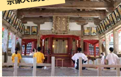
世界遺産である宗像大社を参拝し、国宝の展示を見学！