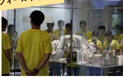
佐賀県立名護屋城博物館見学などフィールドワークも実施！