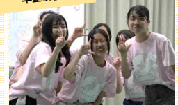
最後の夜は塾生自主企画の前夜祭！最後の思い出を作ろう！