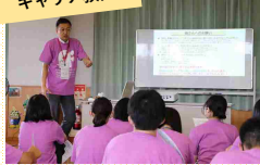
社会人や大学生による学校では教わらないキャリアの授業！