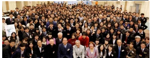
3555名の卒塾生ネットワーク