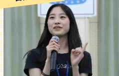
全員の前で自分の夢や目標を声高らかに宣言します！