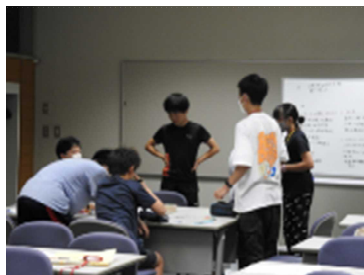
グループディスカッション