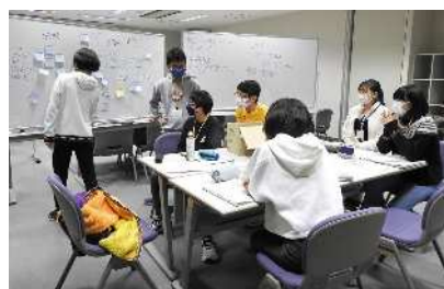
グループディスカッション（後期）