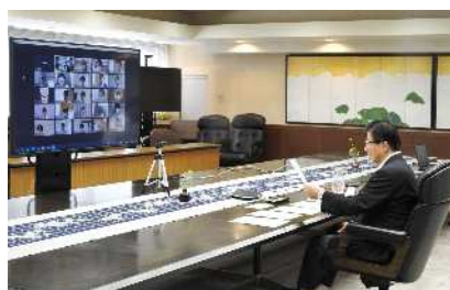
川勝知事による講義（前期）