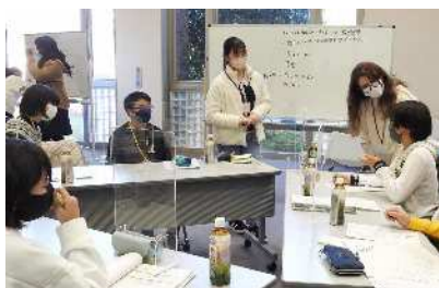
国際交流員・ALTとの交流（後期）