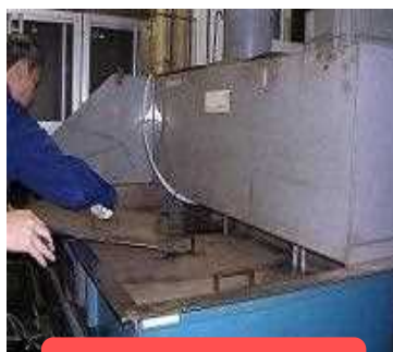
洗浄槽のフタ閉め