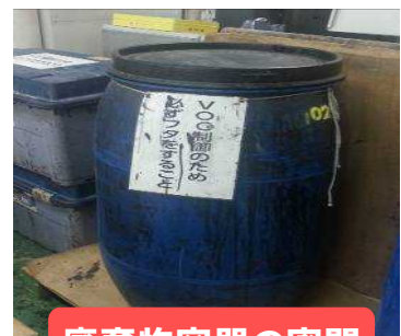
廃棄物容器の密閉

※「VOC拡散防止のため、必ずフタを閉めること」などの貼り紙をするとより効果的です。