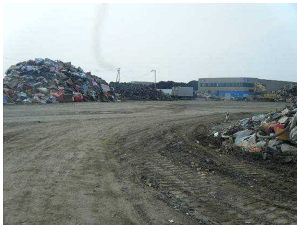
東松島市の自動車用タイヤの仮置場

【取組】 宮城県東松島市では、仮置場における自動車用タイヤの搬出をほぼ毎日行い、保管期間を最小限に留めることにより、蚊の発生防止の取組を行っています。