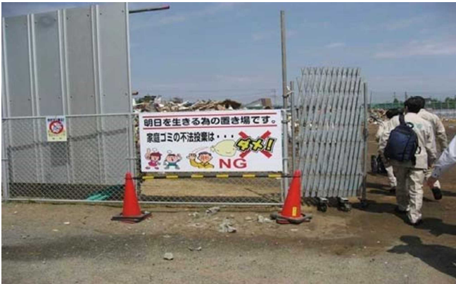
千葉県旭市仮置場ゲート入口の注意看板不法投棄禁止の注意喚起