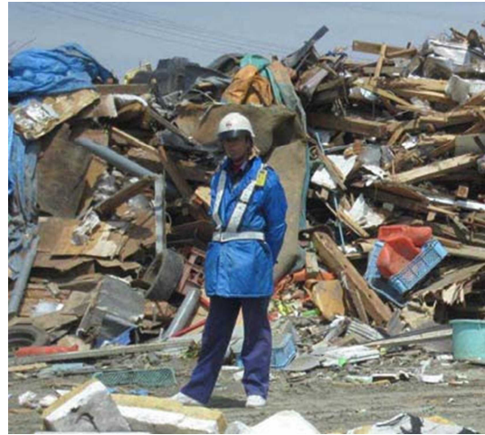
盗難防止のためのガードマン