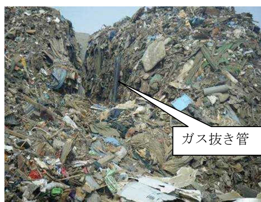
混合物の山に設置されたガス抜き管

【効果】 現場にて目視確認を行ったところ、ガス抜き管からは、湯気が噴き出しており、内部において、発熱と微生物発酵が進行していることが予測されました。このようなガス抜き管の設置によって、火災発生の抑制に効果が見込めるものと考えられます。