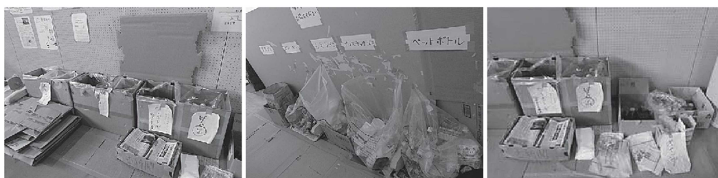
仙台市内の避難所の様子（新聞も分別）

自治体による生活ごみ等の収集が可能な（再開した）場合は、避難所からの避難ごみも同様に収集が行われることが多い。ただし、状況によっては資源ごみの分別は不可能、全て災害廃棄物として収集する場合がある。収集が再開するまでのごみ、さらにその後も資源ごみについては保管が可能ならば、できるだけ避難所で保管する。