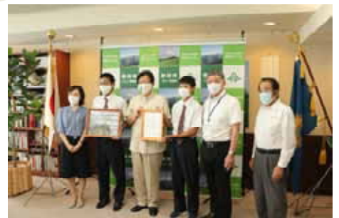
< 委嘱状交付後記念撮影 >

取組の第1弾として、「南アルプス高山植物種子保存プロジェクト」における「ふじのくに生物多様性地域戦略推進パートナー」を県立磐田農業高等学校に委嘱する。 その後は、各プロジェクトの取組内容に応じてパートナーの輪を広げていく。