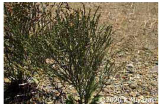
愛知県 2019年8月13日 宮崎一夫