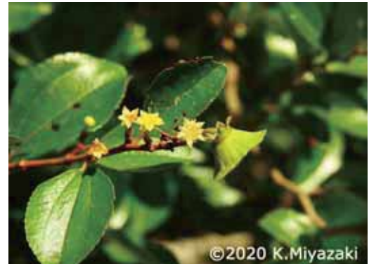
三重県 2019年9月16日 宮崎一夫