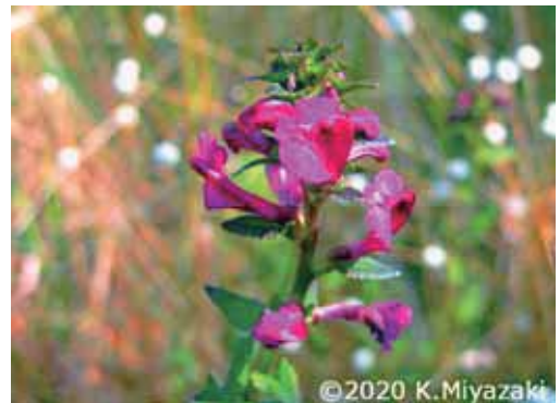
愛知県 2007年10月22日 宮崎一夫