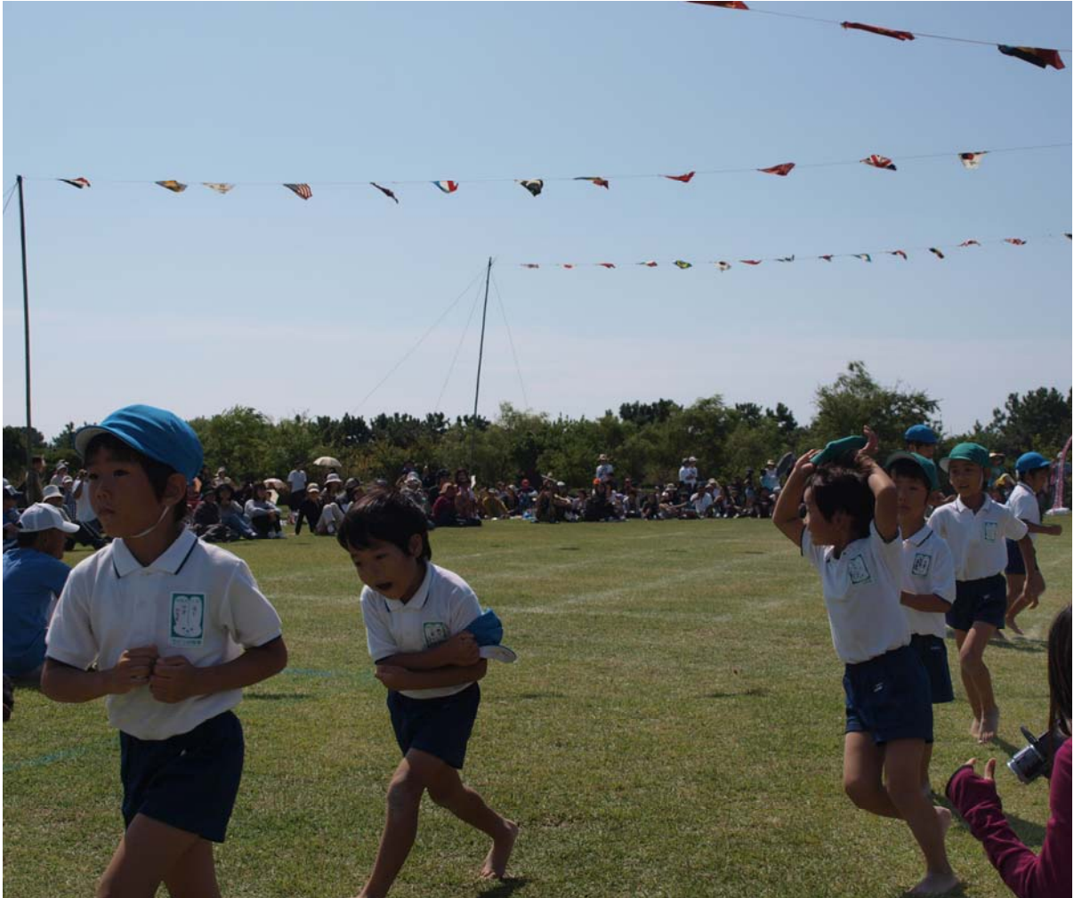
“ふじのくに”の芝生文化の創造を目指し