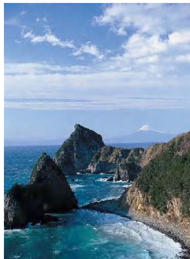
雲見海岸 からの 富士山