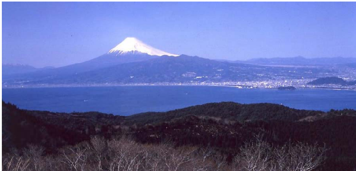
だるま山高原からの富士山