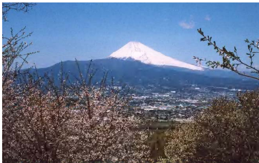
日守山からの富士山