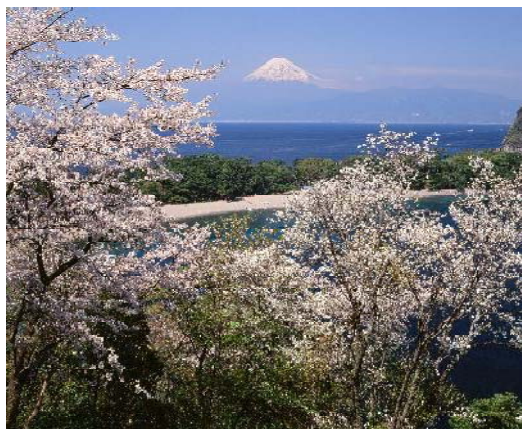
戸田からの富士山