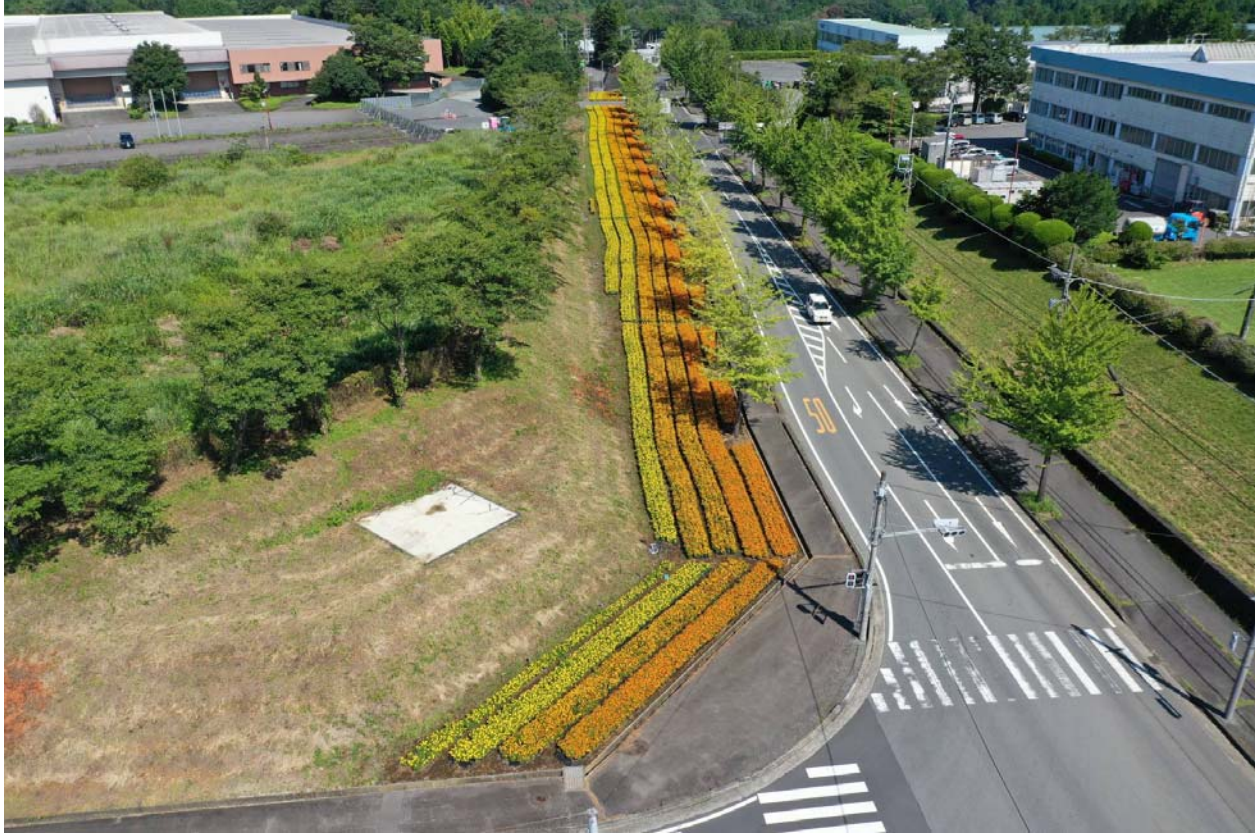
小山町棚頭 オリンピック・パラリンピック 自転車競技ロードコース沿い