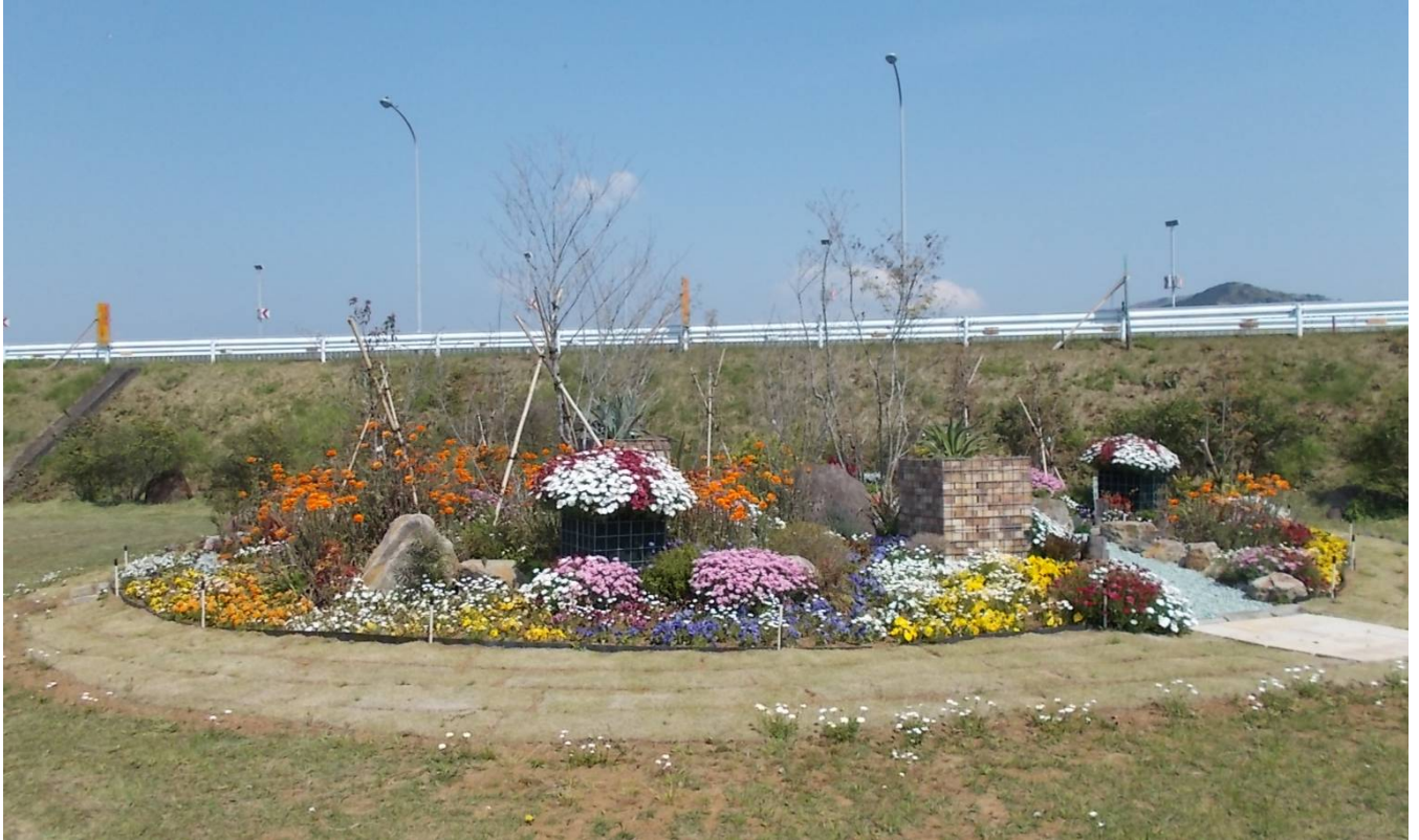
伊豆の国市白山堂 (国)414号 大門橋東詰