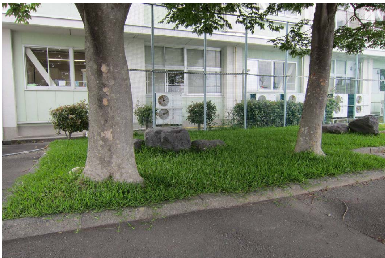
静岡県立吉田特別支援学校 校庭と校舎間の踊り場部分