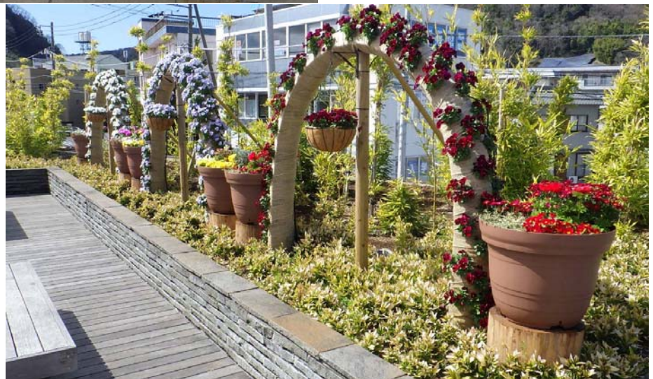
修善寺駅北口 モニュメント(近景)