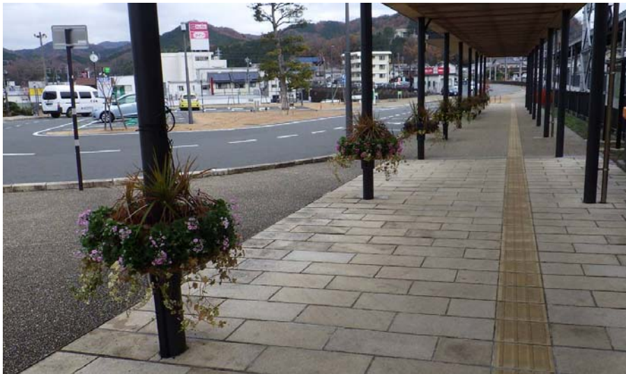
修善寺駅北口 ハンギングバスケット