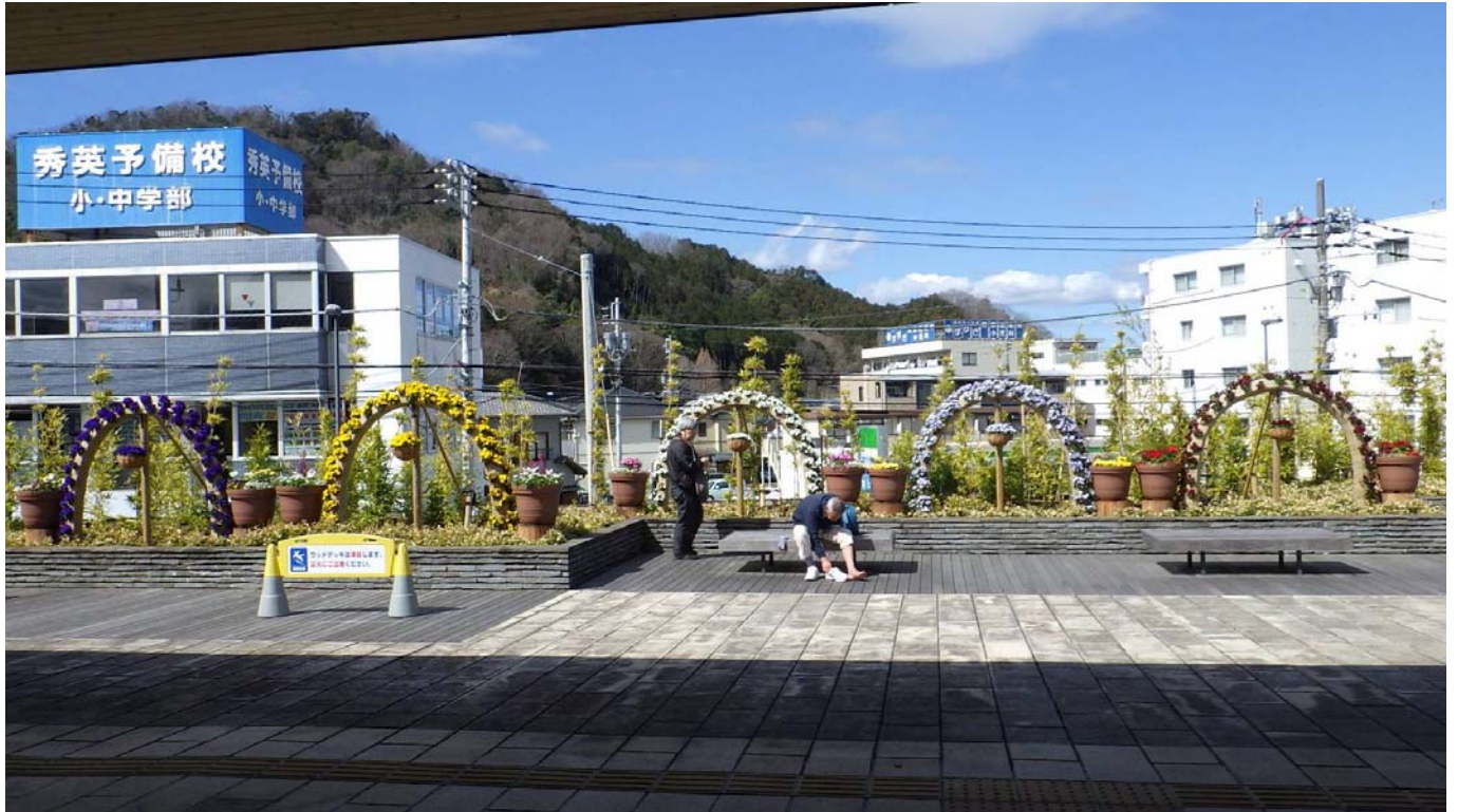
修善寺駅北口 モニュメント