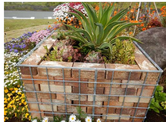
↑ 散水装置を設置するほか、灌木・宿根草を多く配置し、管理の手間を軽減 ↑