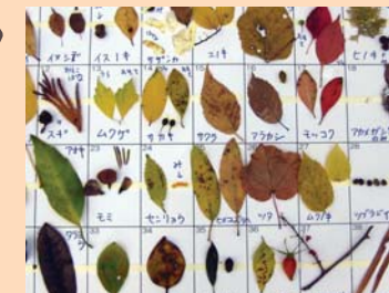
落ち葉や実を集めてみよう

公園や街路樹などにはたくさんの種類の草木があり、樹名板なども設置されていることが多いので、草木の観察には適しています。落ち葉を拾って何種類の木があるか調べたり、葉っぱじゃんけんやクラフトづくりなどをして楽しむこともできます。