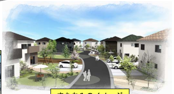
まちなみのイメージ