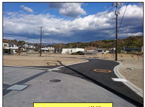
コミュニティ道路