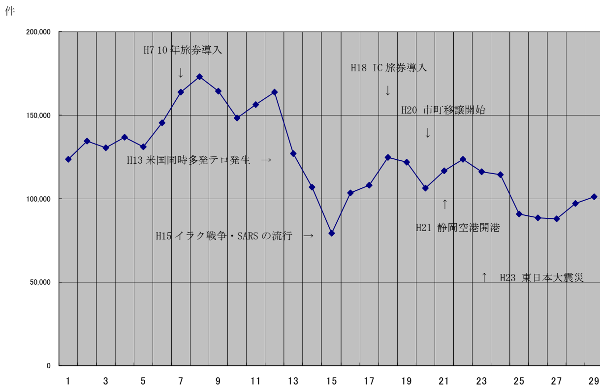
図-3 発行旅券件数の推移（全国）〔暦年〕